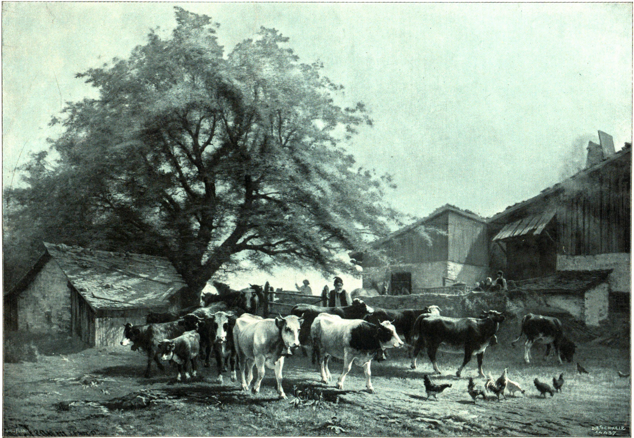
Ranz-des-vaches zu La Joux-Perret. Nach dem Gemälde von Edouard Jeanmaire, Neuenburg, im Museum der Stadt Solothurn.