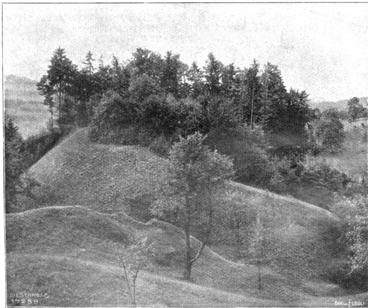
Burghügel der sog. „Geßlerburg“ ob Kühnacht.

Der Stoß verpflanzte sich durch seine Schultern und Alexanders Körper bis hinauf zu In-