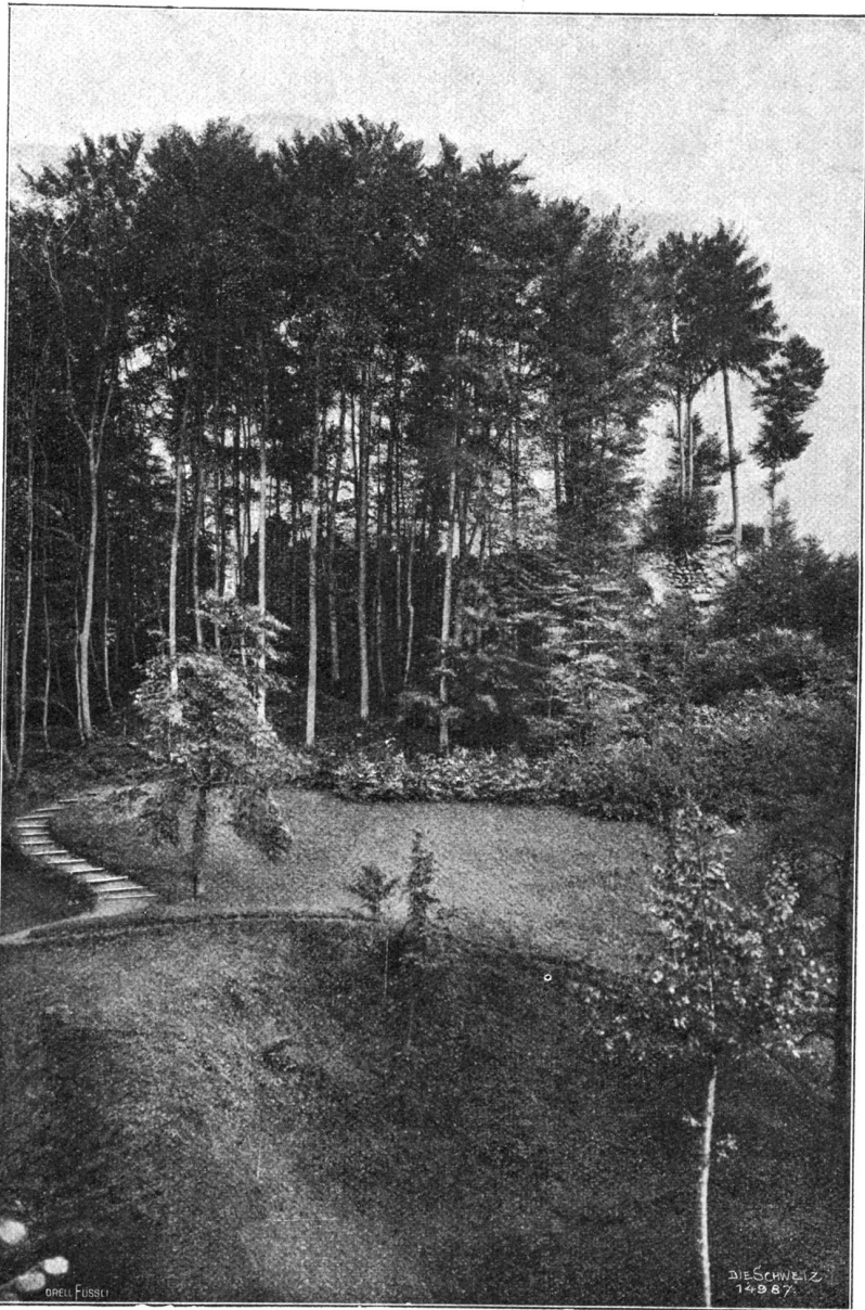
Ueberreste der sog. „Geßlerburg“ ob Küßnacht.

Diesmal hatte sich Jngolf hintenübergeworfen, den Körper fast ausgestreckt haltend. Er fiel, das Gesicht der Manège zugekehrt, mit einer starken Schwenkung des Rückens, mit den Fußspitzen nach der Kuppel des Zirkus gerichtet. In einem blüßschnellen Moment sah er den Blitz in den wachsamem Augen Hugos und seine erhobenen Hände. Unwillkürlich zog er die Füße an sich — den Zehntel einer Sekunde zu spät; aber Hugo hatte sich behend gebückt und ihn im letzten Augenblick doch noch ergriffen. Einen Augenblick schwankte der Knabe, suchte eifrig trippelnd nach einem festen Standpunkt, fand ihn nur mit dem einen Fuß, glitt und blieb hängen. Er saß reitend auf der einen Schulter Hugos.