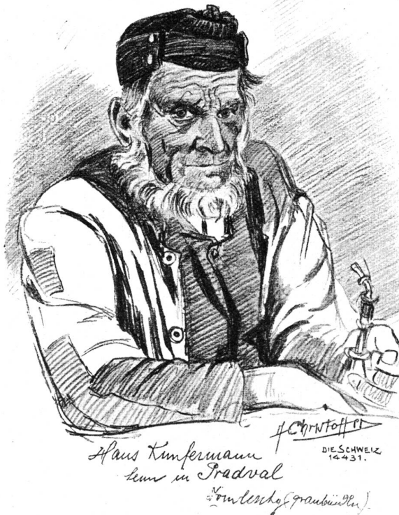
Haus Künfermann Linn in Tradval

Der Schusterschmid sah ein, daß er auf diese Weise nicht weiter komme, und so entschloß er sich zu einem energischen Schritt.