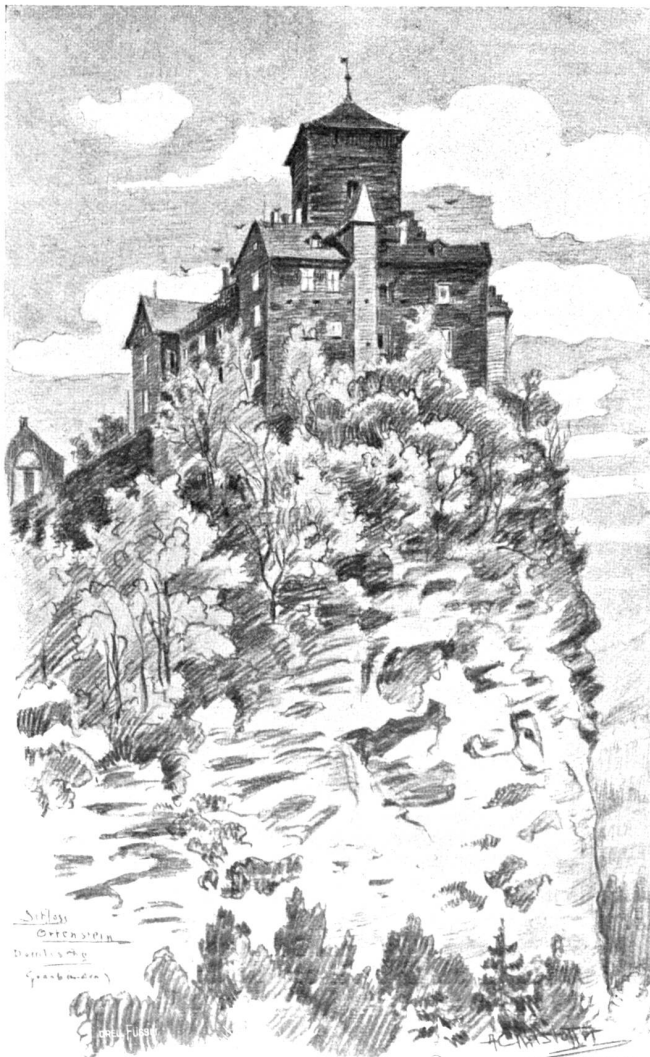
Schloß Ortenstein im Domleschg. Nach farbiger Zeichnung von Anton Ehrlhoffel, Zeana's (Oberengadin).

Seufzend stand sie auf und trat vor das Bild ihres Mannes, das hinter dem Kreuzifix in der Stubenecke hing. Mit nassen Augen betrachtete