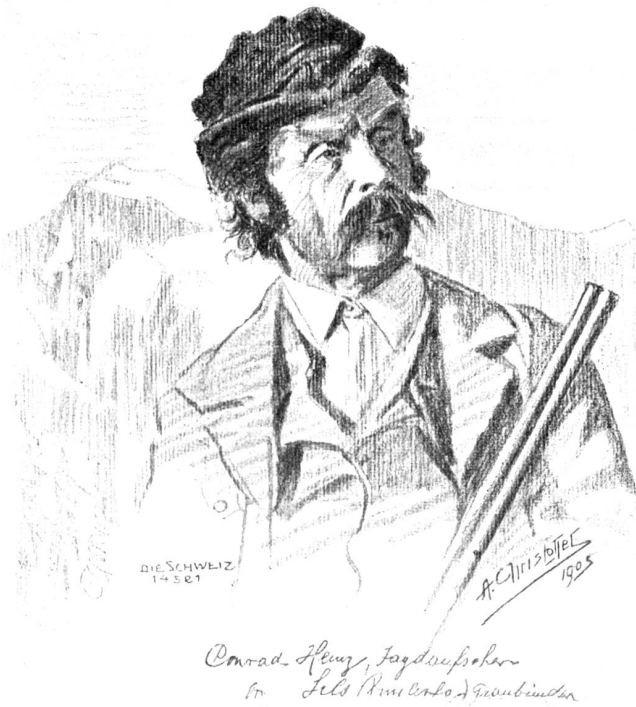
Nach Bleistiftzeichnung von Anton Christoffel, Scanfs (Oberengadin).

Aber einen Augenblick nachher ließ das Feuer eine ganze prasselnde Salve mitten in der Stille los, und die alte Haus-