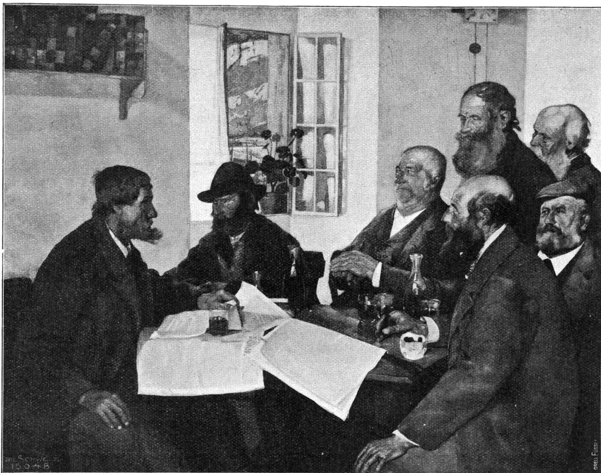
Die Politiker. Nach dem Delgemälde von Max Buri, Brienz (f. S. 454).

Innigkeit berühmte Strophe von Freiligrath (nicht von Bodensiedt, wie Noos meint): „O Lieb, so lang du lieben kannst“ nicht glossiert, sondern geradezu travestiert.