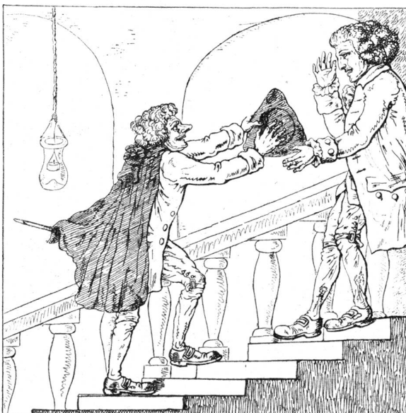
Zweyte Position auf der Treppe

Client: Nein doch, bey Liebe nicht! Ich laß es nicht geschehen! Patron: Ich werde ganz gewiß hinab mit Ihnen geben.