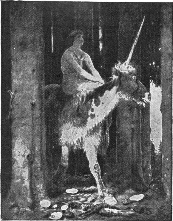
Das Schweigen im Walde.

Nach dem Gemälde von Arnold Böcklin im Besitz von O. Wefendonk, Berlin.