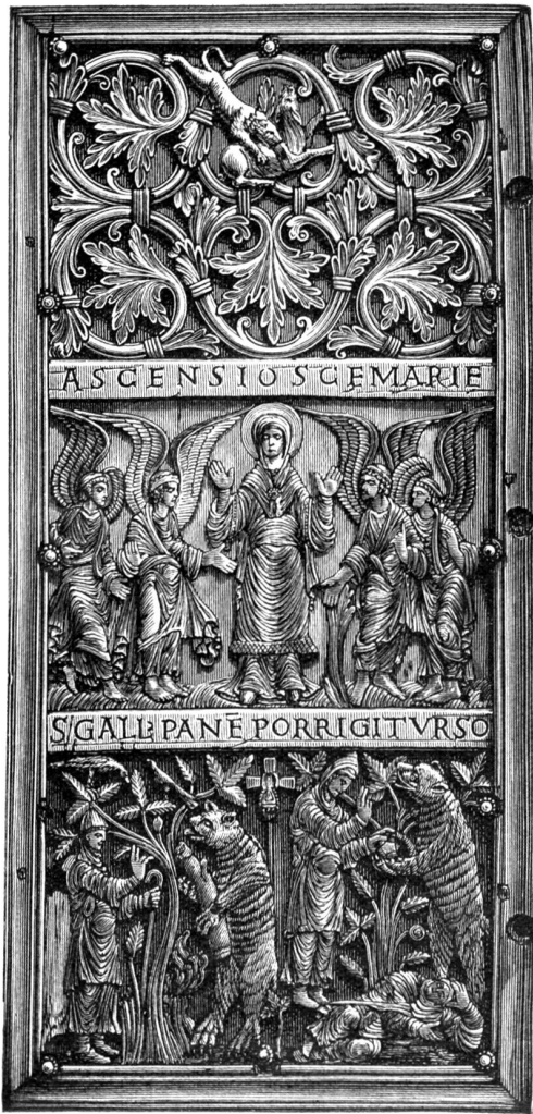
Marlä Himmelfahrt und Szenen aus dem Leben des hl. Gallus. Eisenblechtafel des Mönches Tuotilo († nach 912), in der Stiftsbibliothek zu St. Gallen.

ebensoviel Recht wie Mörike neben Goethe stellen darf. Was die formale Gestaltungskraft anbelangt, so ist Leuthold schwer erreichbar, nicht zu übertreffen. Mit Unrecht wirft man ihm Mangel an Tiefe der eigenen Empfindung vor. Man fühlt aus seinen Versen, daß sein ganzes Ich mitklingt, und ich stehe nicht an zu behaupten, daß Leuthold gar nicht so formvollendet gedichtet hätte, wären seine Gedichte nicht der wahre Ausdruck seiner eigensten Gefühle. Man vergleiche einmal seine Gedichte mit denen Geibels oder Rückerts, und man wird den Unterschied bald heraushaben. Damit ein jeder Leser selber urteilen könne, lasse ich den Dichter in einigen seiner schönsten Gedichte selbst zu Worte kommen: er wird sich selbst der beste Apologet sein.