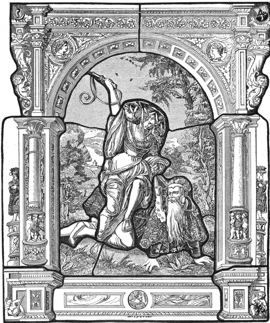
Aristoteles und Phyllis. Schweizerisches Glasgemälde der Sammlung Rahn in Zürich.

Zwei Namen habe ich noch zu nennen vergessen, die zwar zeitlich ziemlich auseinanderliegen und auch sonst nicht mehr miteinander gemein haben, als daß sie in verschiedenen ihrer Dichtungen das Studentum feierten, J. V. von Scheffel und Otto Julius Bierbaum. Scheffel wird heute mit Unrecht hintangeseht; sein Ekkehard ist immer noch der beste kulturhistorische Roman in deutscher Sprache, den wir besitzen, und durch sein „Gaubeamus“ geht doch ein Hauch echter, wenn auch manchmal recht weinfeuchter Poesie. Gerade darum aber soll man ihn als ein gutes Korrektiv auch im Zeitalter des Wassers noch lesen. Feiert Scheffel die alte Burchenherrlichkeit, so feiert Bierbaum in seinen „Studentenbeichten“ die junge. Sein „Stilpe“ ist ein Buch, das immer wieder gelesen werden kann. Eine gewisse kulturhistorische Bedeutung kommt dem Roman zu als dem Vater des deutschen Ueberbrettl's; denn in ihm ist diese Idee für Deutschland zuerst entwickelt worden. Auch seine