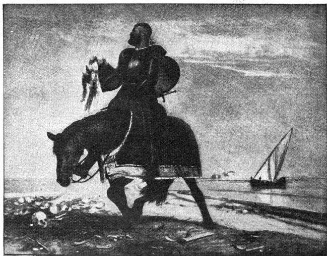
Der Abenteuerer. Nach dem Gemälde von Arnold Böcklin im Besitz des Kunstvereins Bremen.