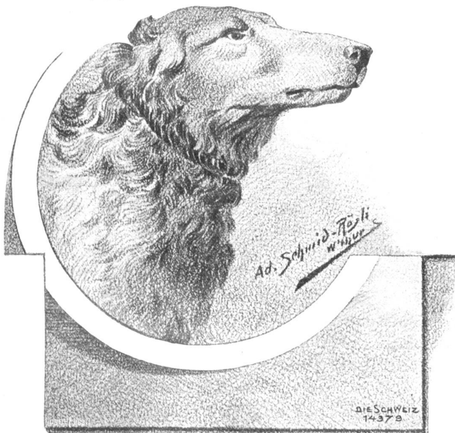
Russischer Windhund. Nach Zeichnung von Ad. Schmid-Rösch, Winterthur.

In ihrem Zimmerchen war es bitterkalt; aber sie öffnete trotzdem noch einmal das Fenster und sah hinaus. Es war eine helle, weiße Nacht; die Drähte, die dicht über ihrem Kopf vom Dach des Hauses nach dem Mast auf dem Giebel des Hotels „Zur Traube“ hinüberliefen, glitzerten. Der Wind hatte sich gelegt. Ueber dem Rhein aber stand eine silberweiße, unbewegliche Nebelschicht, nicht höher als ihr Fenster, sodaß sie darüber hinweg die Höhen des andern Ufers und die Lichter im Fort sehen konnte. Auf der Flut aber lag's mauerndicht. Weder der Zug des Stromes, noch das Geräusch der drüben im Talbahnhof rängierenden Güterzüge drangen zu ihr.