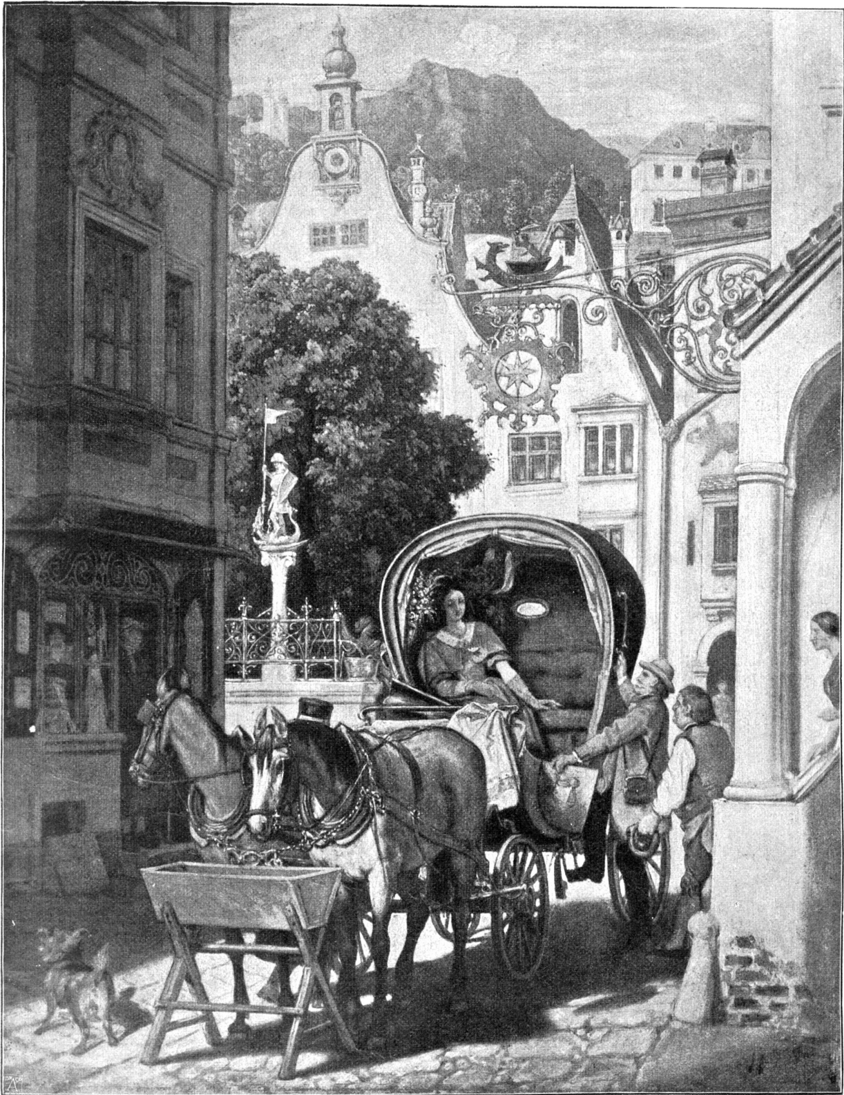
Die Hochzeitsreise (1862).

Nach dem Gemälde von Moriz von Schwind in der Schack-Galerie zu München.