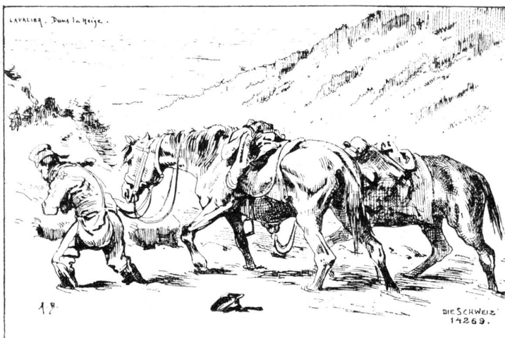
Pferde im Schnee. Nach Zeichnung von Aug. Bachelin (1830–1890).

Die Waffenniederlegung ging meist in Ordnung vor sich. Ganze Haufen und Beigen von Gewehren wurden an den Grenzen angesammelt. Unsere schweizerischen Soldaten benahmen sich dabei recht gut und erzeugten auch den Franzosen gegenüber viel Menschenfreundlichkeit. Unsere Bilder der Maler Aug.