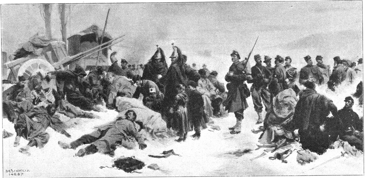
Die Bourbaki-Armee in Verrières. Nach dem Gemälde von Eug. Bachelin (1830—1890) im Museum zu Neuenburg.

möglichen Systemen vorhanden, für die auch die Schießmunition eine verschiedene sein mußte; da geschah es denn etwa, daß einzelne Truppenteile Patronen erhielten, die sie nicht brauchen konnten. Schuhe stunden genug zur Verfügung; doch war ein großer Teil zu eng. Viele Soldaten schnitten später die Schuhspitzen ab, damit sie in den engen Schuhen gleichwohl marschieren können. Dieses Aushilfsmittel mußte sich aber in der Folge im Winterfeldzug als ein verhängnisvolles erweisen. Ähnlich war es auch mit der Verpflegung und dem Transportwesen; an Geld zur Anschaffung des Nötigen fehlte es nicht; aber es mußte alles überstürzt werden, und als es dann mit der Expedition schlecht ging, ließen die getroffenen Anordnungen die Armee erst recht im Stich.