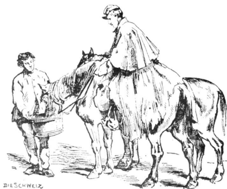
Labung der Pferde. Aug. Bachelin (1830–1890).

Von diesen und andern Plätzen aus erfolgte dann der Weitertransport der zu Internierenden. So nahe an der Grenze war es noch nicht möglich, eine befriedigende Ordnung herzustellen; man war zu sehr überrascht und die Menge der Fremden zu groß. Die Zahl der Uebertretenden war von berufener Seite auf etwa 42,000 angegeben worden; nun kamen aber 86,000. Es handelte sich daher darum, die zu Internierenden so rasch wie möglich zu verteilen, in der Annahme, daß es dann den Kantons- und Gemeindebehörden in der ganzen Schweiz herum wohl gelingen werde, Ordnung in die Sache zu bringen. Es wurden daher auf Plätzen wie Neuenburg, Yverdon, Orbe usw. vorweg ganze Kolonnen von französischen Soldaten, die vorher gespeist worden waren, wie sie sich gerade fanden, Waffengattungen und Truppenteile bunt gemischt, gebildet und durch schweizerische Truppen nach weiter zurückgelegenen Plätzen eskortiert, so z. B. nach Freiburg, Murten, Payerne usw.; Abteilungen von 12–1500