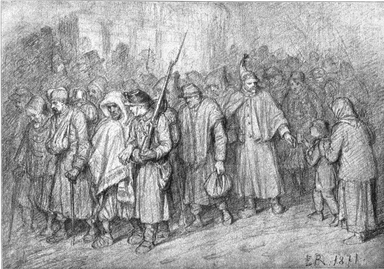
Ueberreste der Bourbaki-Armee bei ihrer Ankunft in St. Gallen. Nach einer Originalzeichnung von Emil Rittmeyer (geb. 1820) im Museum zu St. Gallen.

Baden, Freiburg, St. Gallen, Interlaken, Luzern und Zürich, in welchen Plätzen sie in den vielen Gasthöfen Quartier fanden. Die Mannschaft dagegen wurde in den Städten, großen Dörfern und andern geeigneten Plätzen in geräumige Bereitschaftslokale untergebracht. Für die Reinlichkeit der Soldaten wurde nun das Möglichste getan, ebenso für die Ausbesserung der Kleidung. Die französische Regierung sandte einen reichen Vorrat von Kleidungsstücken jeder Art, der an diejenigen, die am meisten bedürftig waren, verteilt wurde. An einigen Orten wurden Lesesäle mit französischen Büchern und Zeitungen eingerichtet, und, wo es anging, konnten die französischen Soldaten bei den Bürgern gegen Lohn Arbeit, zu der sie ihrem Beruf nach taugten, verrichten. Ein eigenes Nachrichtenbureau wurde in Bern unter Leitung des Stabsmajors Davall eingerichtet. Weitere fünf schweizerische Offiziere und bald auch bis auf sechs- und vierzig französische Unteroffiziere waren darin tätig. Es handelte sich darum, all den französischen Familien, die nach ihren Söhnen fragten, deren richtige Adressen aufzugeben, auch ankommende Briefe genau zu adressieren. Es kamen nämlich jetzt massenhaft Briefe, Pakete und Geldsendungen, die schon lange nicht hatten bestellt werden können, aus Frankreich an; zwei Tage nach Eröffnung des Bureaus trafen von Dijon mehr als 200,000 Briefe in zehn großen Säcken ein, nachher andere Ballen aus