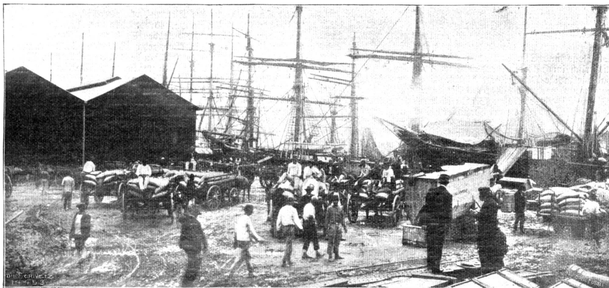
Verladen des Kaffees im Hafen von Santos.

hier europäische Kultur vorherrscht, und ein Besuch der schönen Villenviertel zeigt uns da Besitzungen, die sich auch in entsprechenden Quartieren einer europäischen Großstadt blicken lassen dürften. Das von einer amerikanischen Gesellschaft erstellte und betriebene elektrische Tramway sorgt nebst den vielen neapolitanischen Kutschern vortrefflich für die rasche Personenbeförderung. Die Stadt St. Paulo verdankt ihre rasche Entwicklung ausschließlich dem Kaffeegeschäft; denn wenn Santos der Haupthandelsplatz für dieses Produkt ist, so ist St. Paulo der Ort, wo der Gegenwert der kolossalen Massen exportierten Kaffees als großer Wohlstand vor die Augen tritt, indem Universität, Polytechnikum, Vergnügungsorte und natürlich auch die Kirche dort ihre Hauptitze haben und sowohl Großkaufleute als Gelehrte, Handwerker und Rentner zahlreicher Nationalitäten dort wohnen. Man schätzt die Einwohnerzahl der Stadt St. Paulo auf 250,000 Seelen, wovon 100,000 Italiener und 25,000 Deutsche. St. Paulo bietet viel Interessantes. Da ist ein neu angelegter botanischer Garten und das von einem deutschen Gelehrten geleitete Nationalmuseum. Die Umgebung, auch die weitere, ist reich an lohnenden Ausflügen. Trotzdem wollen wir nicht