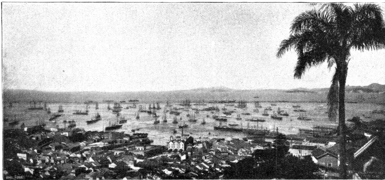
Der Hafen von Rio de Janeiro.

durch Martin Affonso de Souza die erste Ansiedlung angelegt wurde. Der Dampftram führt uns, von einer Winterthurer Lokomotive gezogen, direkt nach Santos zurück, und da dieses nach dem schönen Rio keine besondere Anziehungskraft auf uns auszuüben vermag, eilen wir nach der englischen Bahn, die uns in die 759 Meter über Meer gelegene Staatshauptstadt St. Paulo führen soll.