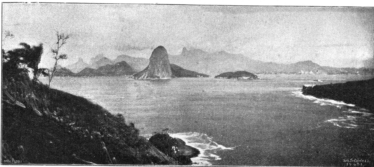
Einfahrt in den Hafen von Rio de Janeiro.