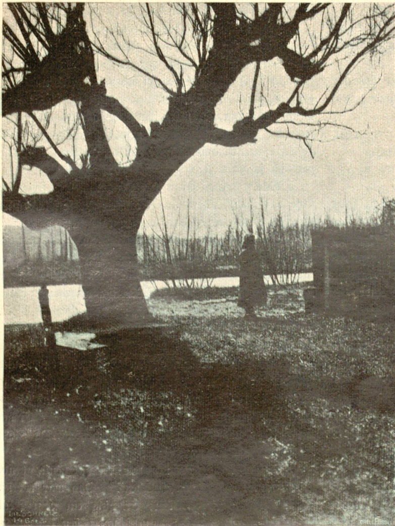
Abendstimmung im Limmatthal.

Sie unterhielten ja seit vier, fünf Jahren gar keinen Verkehr mehr. Als Frau Horn Mila aufnahm, da hatte sie jede Verbindung mit der Gesellschaft abgebrochen. Nicht um ihrer selbst willen, auch nicht, weil sie das Mädchen als Deklassierte behandeln zu müssen glaubte, sondern nur, um ihm Kämpfe zu ersparen, Demütigungen und Schmerzen. Und Mila hatte der Tante nichts mehr gedankt als diesen stillen Verzicht, der der Mutter Donalds nicht so leicht gefallen war; denn sie schied