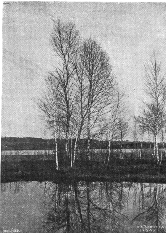
Am Katzenssee bei Zürich.

Sein Gesicht hatte sich nicht erhellt, und Donald bereute jetzt seine Unvorsichtigkeit, bereute sie doppelt, weil ihm die Frage auf der Zunge lag, was Philipp