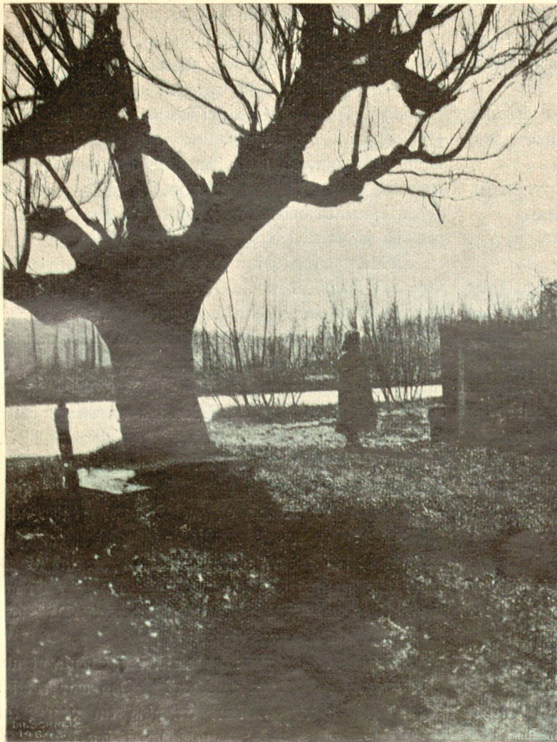
Abendstimmung im Limmat.

Sie unterhielten ja seit vier, fünf Jahren gar keinen Verkehr mehr. Als Frau Horn Mila aufnahm, da hatte sie jede Verbindung mit der Gesellschaft abgebrochen. Nicht um ihrer selbst willen, auch nicht, weil sie das Mädchen als Deklassierte behandeln zu müssen glaubte, sondern nur, um ihm Kämpfe zu ersparen, Demütigungen und Schmerzen. Und Mila hatte der Tante nichts mehr gedankt als diesen stillen Verzicht, der der Mutter Donalds nicht so leicht gefallen war; denn sie schied