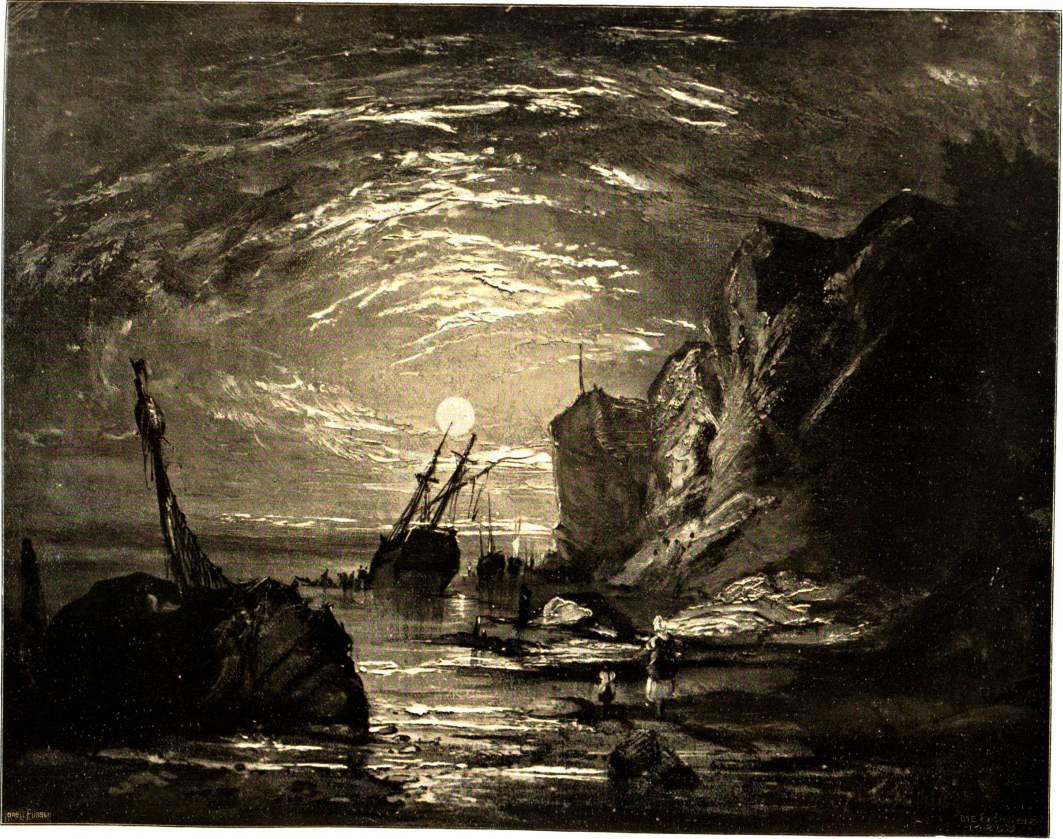
Mondschein an der Küste von Wales. Nach der Farbenskizze von Jos. Mallord William Turner (1775–1851) im Museum der Stadt Solothurn.