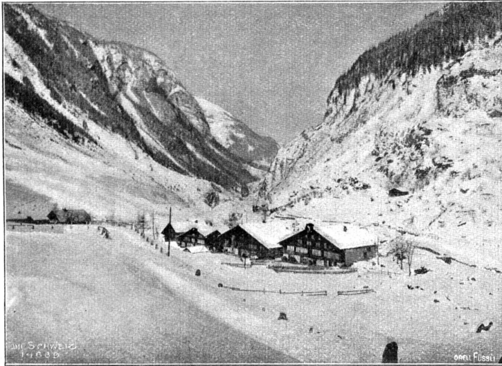
Lawinsturz im Haslital beim Dörfchen Boden (23. Februar 1904 abends 7 Uhr). „Im Boden“.