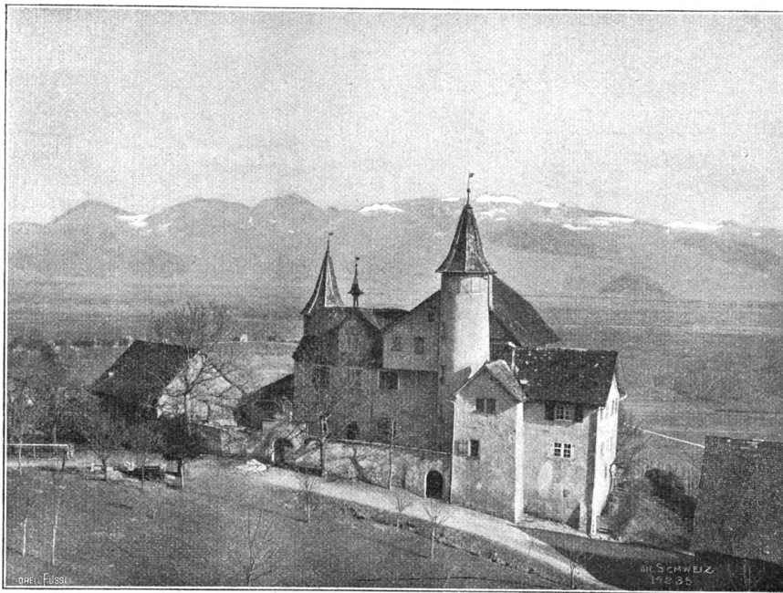
Schloss Weinstein bei Marbach im Rheintal. (Phot. C. Baer, Altstätten).

Zwei Tage später geschah es, daß einige Herren aus des Kaisers Gefolge an der Richtstätte vorübergingen, und da sie nach dem Galgen schauten, schien es einem von ihnen, als sei es nicht mehr derselbe Körper, der dort hing. Ohne darum Herrn Ebert etwas zu sagen, da sie mißgünstige Leute waren, teilten sie am Abend zu einer gelegenen Stunde dies dem Kaiser Friedrich mit, der sich stark darob betrübt und erzürnte. Und am folgenden Tag begab sich der Kaiser selbst auf den Richtplatz, wo Herr Ebert noch immer seines Amtes wartete. „Undankbarer,“ rief der Kaiser ihm zornig zu, „wie hast du deiner Treue und Pflicht vergessen! Denn ich weiß wohl, daß dieser Leichnam nicht der meines Feindes Ottokar ist, sondern ein anderer.“ — „Gnädigster Herr,“ antwortete der Wächter, „wer hat Euch solche unwahre Verleumdungen erzählt? Es ist jetzt der dritte Tag und war heute die dritte Nacht, daß ich nicht von diesem unseligen Ort gewichen bin, und ich hatte gehofft, Euch durch solchen Eifer meine Liebe und Treue zu beweisen, sehe nun aber wohl, daß böse Gesellen mir solches angetan und Euch schlimme Lügen über mich berichtet haben. Aber wohlán, Herr Kaiser, wenn Ihr mir nicht zu glauben vermöget, so sendet nach jenem Kloster, wo ein gewisser junger Ritter Hildebrant ist. Dieser hat den Geheften gut genug gekannt und mag entscheiden, ob er es sei oder nicht sei.“