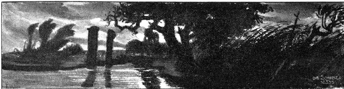
Mondschein. Kopfleiste von E. Weber, Engstringen.