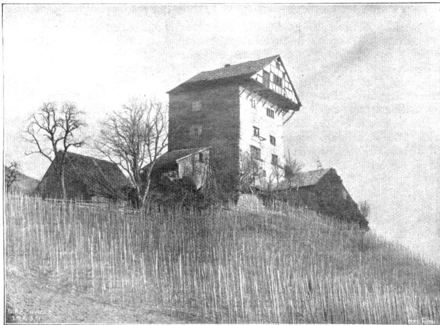
Burg Neu-Altstätten im Rheintal (Phot. C. Baer, Altstätten).

„Wohl habet Ihr mich gesehen,“ erwiderte Hildebrant;