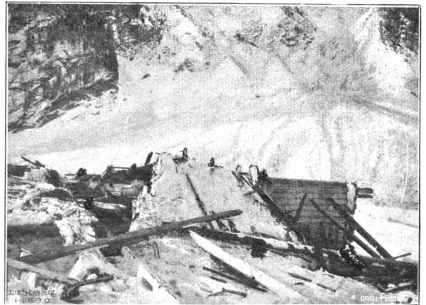
Lawinsturz im Haslital. Vom Luftdruck zerstörte Scheune in der „Schwendli“ (Phot. Ad. Urfer, Interlaken).

Garzafef. Die Frau ist eine Russin der Beaumonde: sie will nicht in der Steppe und im Zelt wohnen. Aber Garzafef liebt sein Zelt und sein Volk. Er lebt in seiner Kibitka, besucht sein Haus und seine Familie in der Stadt. Seine Tochter ist halb erwachsen. Ihre Züge sind ganz diejenigen des Vaters: typisch kalmlückisch. Dort reiten sechs Reiter in eleganter, tscherkessischer Tracht, mit Burka und Gürtel, die schwarzen Pelzmützen aus der olivbraunen Stirne zurückgeschoben. Sie sitzen hoch auf dem Rücken der Pferde im engen, hohen, kaukasischen Sattel. Die blanken Kinschale funkeln in der Sonne. Sie sind nicht „Dschigiten“ mit zerlumpten Kleidern, aber vorzüglichen Waffen und kostbaren Pferden. Nein, bei ihnen ist alles komplett. Sie sehen aus wie Fürsten und Herrscher von männlicher, phantastischer Schönheit, die herablassend sich am Fest ihres Volkes zeigen und es ehren, indem sie in feinsten Gala auftreten. Ihre Pferde sind klein und wie Hirsche gebaut, aber stark und geschmeidig wie Panther. Mit aufgerissenen Nüstern und spähenden Augen und Ohren bewegen sich diese Tiere in trippelndem, schnellem Trab oder in energischem und doch graziosem Galopp. Ueber den Hinterteil des Tieres, ihn bedeckend, hängt die weite Burka aus schwarzem, langhaarigem Filz; Sattel, Zaum, Gebiß und Bügel sind prunklos;