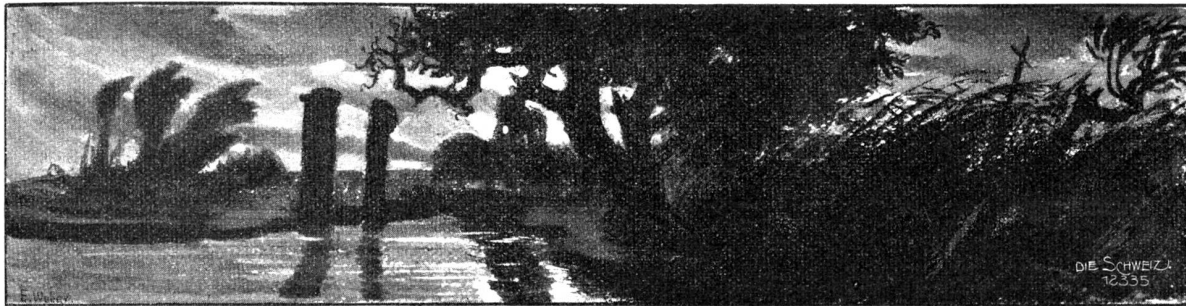
Mondschein. Kopfleiste von E. Weber, Engstringen.