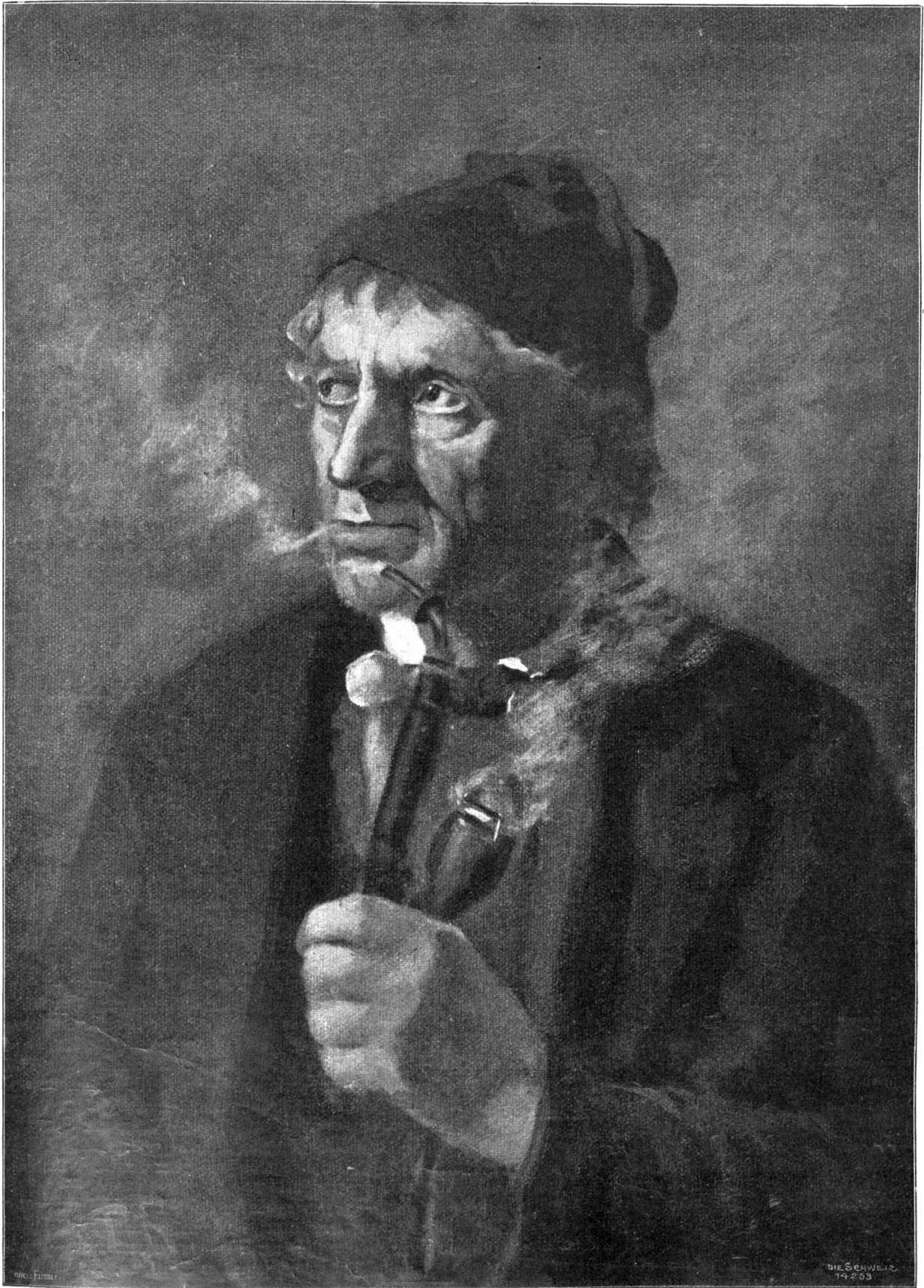
Rauchender Bauer. Studienkopf (in Del) von Paul Nüetzi, Suhr-München.