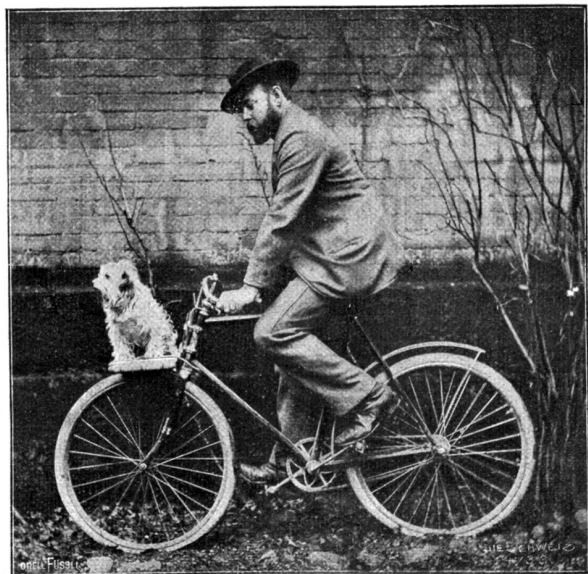
Wie ich radfahren lernte...

Einige Tage bekam ich trotz des schönsten Wetters, das wir damals hatten, die verwünschte Maschine gar nicht zu Gesicht, und ich hatte schon gehofft, daß er das dumme Madeln definitiv aufgegeben hätte. Da — es war an einem Samstag; ich erinnere mich noch ganz gut, weil es am Samstag immer Skoteletten gibt und ich stets einen kleinen Vorrat von den