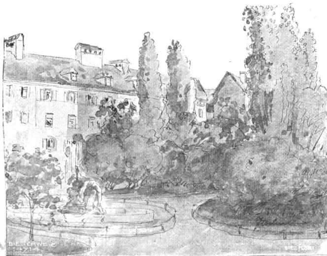
Herzog Wilhelm-Straße in München.