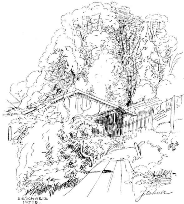
Alte Kegelbahn in der Au bei München.

„Ich weiß nicht, was Sie denken, Philipp. Ich will es nicht wissen. Auch fragen dürfen Sie nicht mehr. Aber behalten Sie, was ich Don gesagt habe; ich hab's auch für Sie gesagt: Mila ist und Mila bleibt mein liebes, mein armes Kind.“