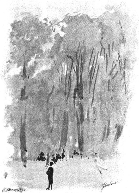
Im Englischen Garten zu München.