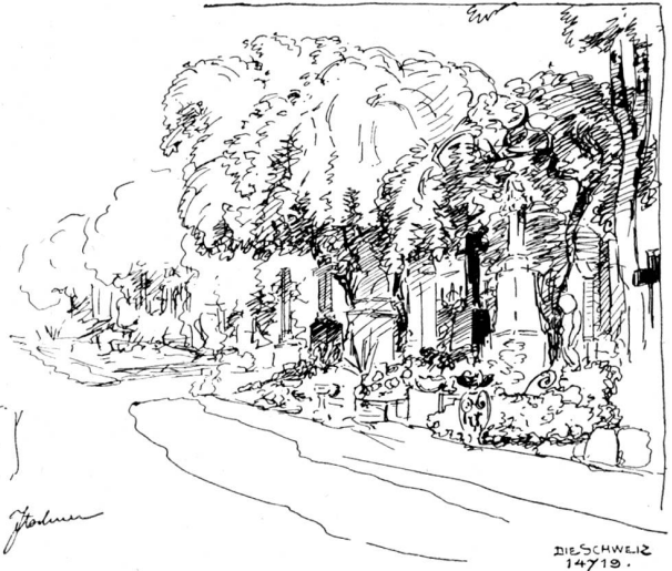
Südllicher Friedhof in München.

Er hatte keine Antwort mehr bereit; ihr klarer Blick verwirrte ihn. Ein Schmerzfüßchen brannte in der Tiefe ihrer Augen, und auf einmal stand eine andere Frau vor ihm, zarter, unscheinbarer als Eva, aber mit demselben wehen Zug in den Mundwinkeln. Es war auch