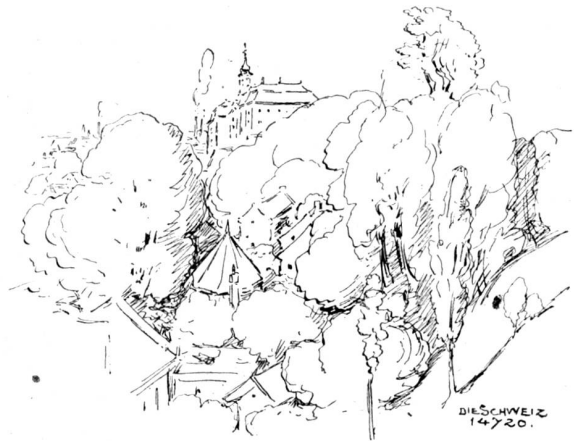
Die Au von der Hochstraße (München).