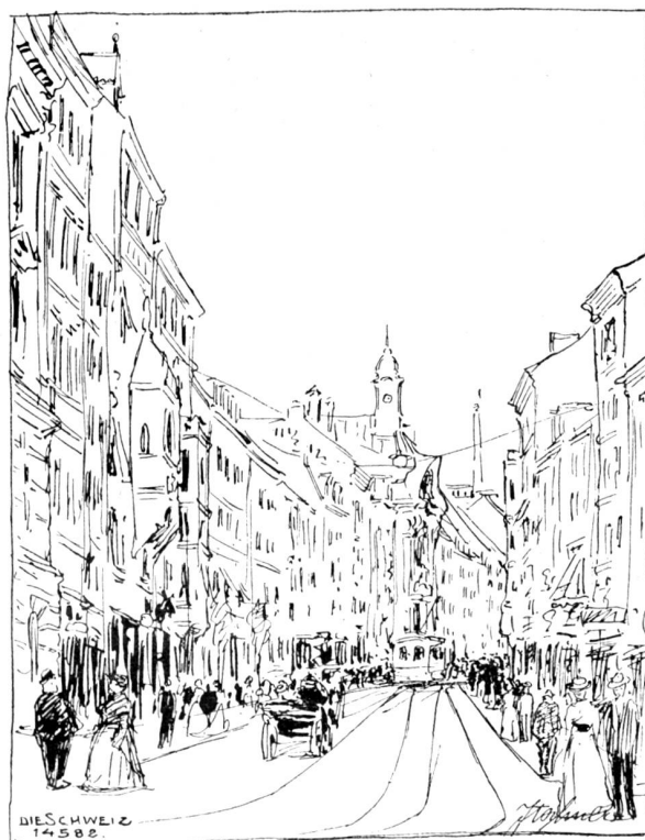
In der Sendlingerstraße zu München.

„Du gehst mit, ja,“ murmelte er; „aber bei mir bist du nicht.“