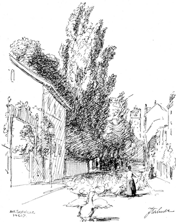
Entenbachstraße in München.

Es war leer in dem tagsüber wenig besuchten Lokal.