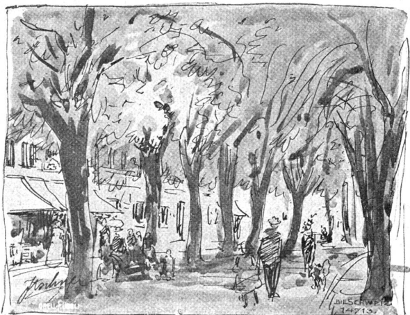
Am Anger in München.

„Gunter?“ kam es erregt von den Lippen der alten Frau, und ihr Auge suchte das Gesicht des Sohnes. Donald war ruhig geblieben. Seit gestern hatte er sich wieder vollkommen in der Gewalt.