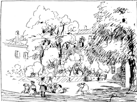
Im Theaterhof in München.

Immer noch klang die Stimme sanft und zärtlich; aber jetzt erschienen die ersten Tränen in ihren Wimpern und rollten langsam die schmalen Wangen hinab.