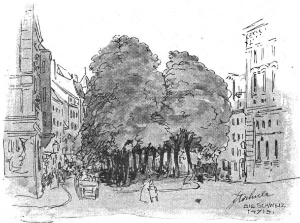
Der obere Anger in München.

„Don!“ zitterte es noch einmal von ihren Lippen, und ihre Finger streichelten seinen Rockärmel, als könnte das ihm Linderung bringen.