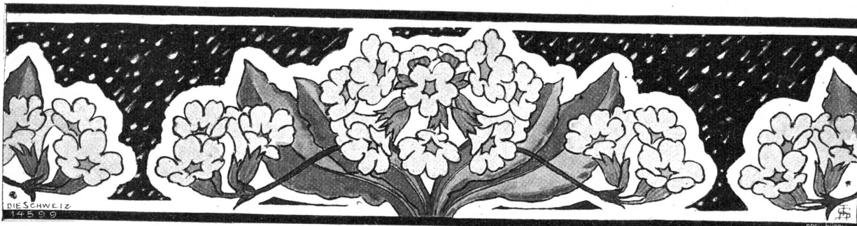
Primula veris. Kopfleiste von Anna Stauffacher, St. Gallen.