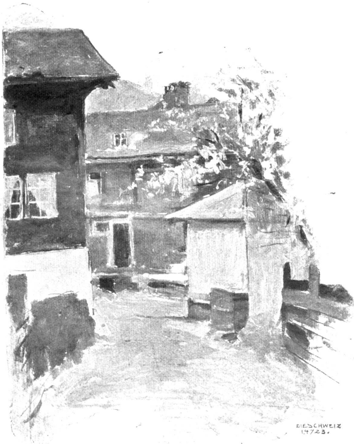
Aus einem Skizzenbuch von Jacques Ruch, Schwanden-Paris.

„So, nun stelle ich den Wagen bei Zielkes in der Kreuzbergstraße ein und fahr' mit den Kindern auf der Elektrischen hinaus,“ sagte Frau Kuhl, als sie unten angekommen waren.