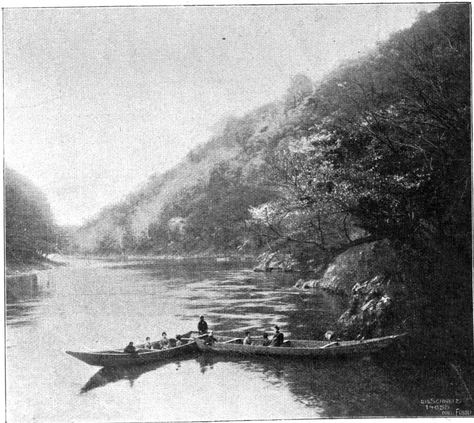
Flussbild bei Rioto.