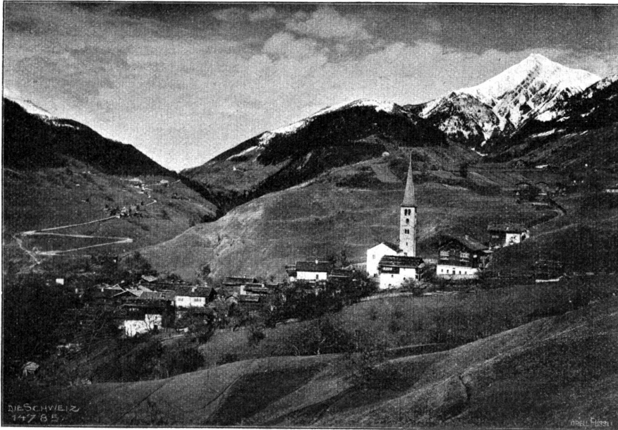
Grengiols im Oberwallis (Bezirk Navon); links die Furkastraße.

sein Vater sich nach seinem Leben in den verflossenen Jahren erkundigte, tauchte plötzlich, wie ödes Felsenland aus dem Nebel, seine schlummernde Existenz als Lastträger des Maurermeisters wieder auf, und Salomes werktätige Liebe, die ihn vom Untergang beschützte, strahlte aus dem Dunkel.