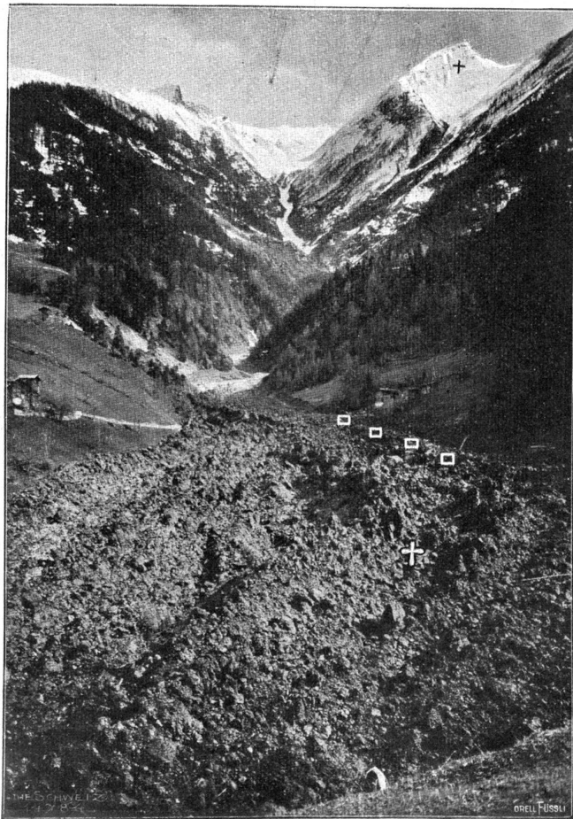
Lawinenunglück in Grevin. Das Lawinenfeld.

In Genf angekommen, stieg er wieder bei der „Wage“ ab und traf alsbald seine alten Bekannten, den ehrenwerten Syndicus, seinen Maitre de plaisir, der ihm alsbald um den Hals fiel, die Herren Tondchin, den berühmten Arzt und seinen Bruder, den Bankier, die drei Schönen, den Genfer Pfarrer und die