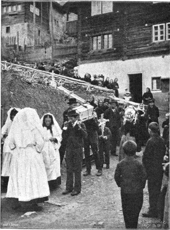
Lawinenunglück in Grenchols. Szene aus dem Leichenzug.

Manuskripte in Dux vermögen darüber vielleicht Auskunft zu geben. In guten und schlechten Tagen hat die schweizerische Kultur an Casanovas Leben teilgehabt und ihn schließlich auch literarisch gefördert. Sein Schweizer Aufenthalt gibt, wie wir gesehen, namentlich über das geistige Leben der Schweiz im achtzehnten Jahrhundert hübsche Ausblicke, und wir erkennen wieder, daß seine Memoiren von der höchsten Wahrheitsliebe, die durch andere Zeugnisse bestätigt wird, geleitet werden. Für den Zustand der damaligen Gesellschaft der Schweiz dürften seine Erlebnisse wohl einige Lichter abgeben, wobei aber natürlich nicht generalisiert werden darf; denn Casanova suchte lediglich die Gesellschaft auf, die ihm paßte. Es war vorwiegend die französische Gesellschaft der Schweiz, auf deren Sitten eben sein besonders gutes Licht fällt. Dem Schweizervolk kurzweg kam ja Casanova überhaupt nicht nahe, und die Naturschönheiten der Schweiz wußte er kaum einmal als echter Romane zu würdigen. Er reiste, um die Gesellschaft beson-