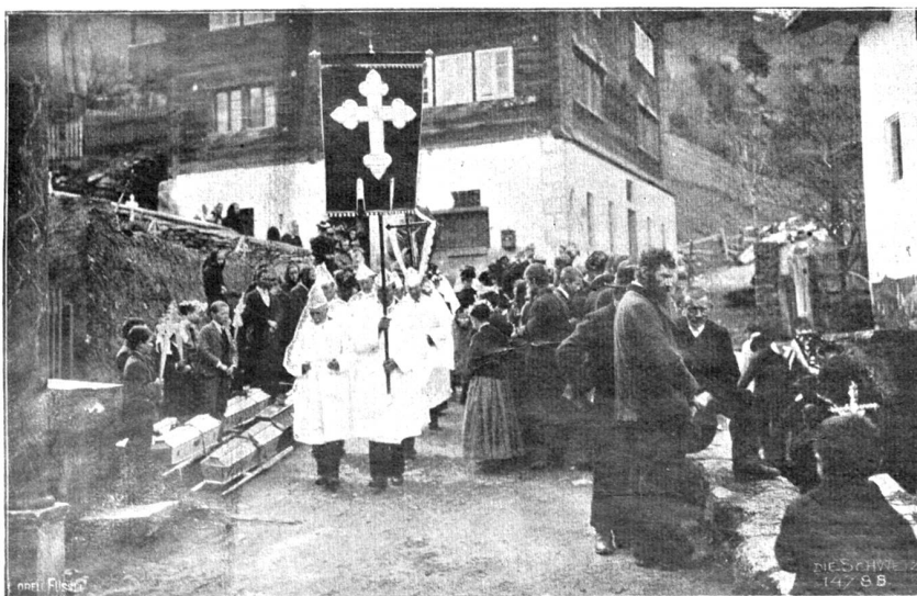
Lawinenunglück in Grengiols. Szene aus dem Leichenzug.

Casanovas kometenartiges Gestirn senkte sich immer tiefer, um in Nacht zu entschwinden; denn auch das Manuskript seiner Memoiren hatte bis jetzt unaufgeklärte Abenteuer und ist nur durch einen Zufall erhalten geblieben. Die Memoiren enden 1774, und bis dahin war Casanova nicht mehr in der Schweiz; ob er auf seinen spätern Reisen diese flüchtig berührt hat, ist uns unbekannt geblieben; die bis jetzt fast unausgebeuteten