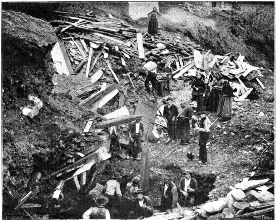
Lawinenunglück in Grengiols. Aufsuchung der Verunglückten.

Erst 1769 wieder betrat er Schweizerboden und zwar in Lugano. Casanova war schon ein müder Mann; England namentlich hatte ihn gebrochen, und er mußte darauf bedacht sein, seine Zukunft mehr im Auge zu haben und sich eine Unterkuft zu sichern. Zu diesem Behufe wollte er sich mit der Republik Venedig ausöhnen. Eine Widerlegung des giftigen Werkes von Amelot de la Houssaye: «Histoire du Gouvernement de Venise» sollte ihm die Handhabe dazu bieten. In sechs Wochen arbeitete er also in Lugano diese Widerlegung aus und ließ sie daselbst bei Agnelli drucken. So hat die Schweiz denn auch an Casanovas literarischen Arbeiten Anteil. Da das Werk sehr selten geworden, trotzdem es in zwölfhundert Exemplaren verkauft worden ist und Casanova tausend