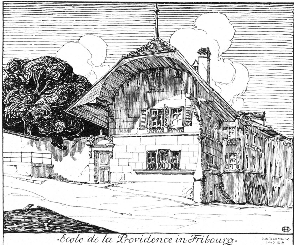
Nach Federzeichnung von Erwin Seman, Basel.

Da blieb Philipp Wentgraf erschüttert stehen, die seltsame Eifersucht und das nagende Weh verfluchend, das er egoistisch vorangestellt hatte.