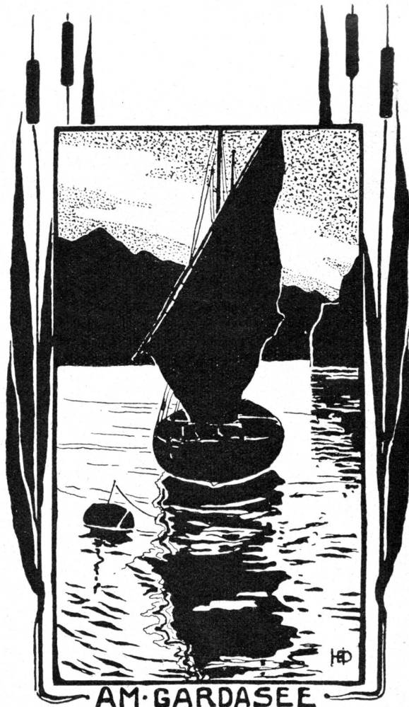
Nach Federzeichnung von Hedwig Diegi-Bion, Bern.

Jean-Paul liebte Ingolf nicht weniger. Aber sein Interesse war ein wenig verdunkelt worden. Er konnte die Sache nicht mehr mit der gleichen warmen Energie angreifen wie