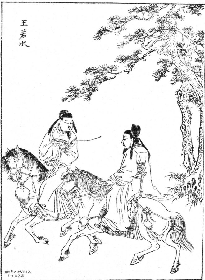
Aus einem ältern japanischen Bilderbuch.