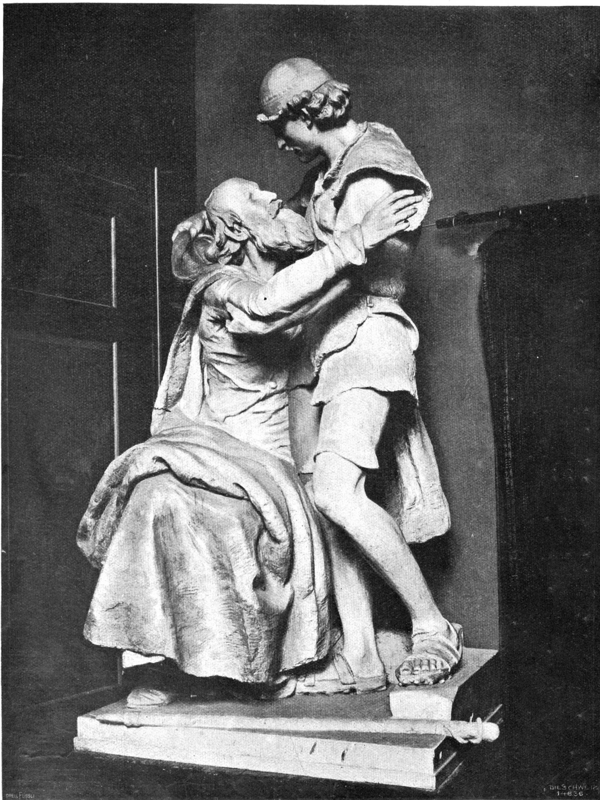
Melchtalgruppe. Nach dem Gipsmodell von Richard Kissling, Zürich.