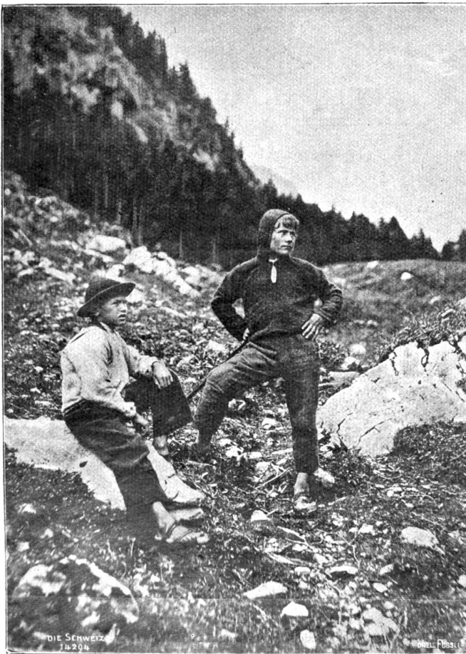
Geissbuben im Schächental (Phot. Josef Muehle, Luzern).

Er trat auf den Balkon hinaus. Ein frischer Wind kam vom Kanal her, und unten in dem schwärzlichen Geäst der Bäume regten sich gelbliche Flecken, die ersten Triebe. Ein fernes Summen,