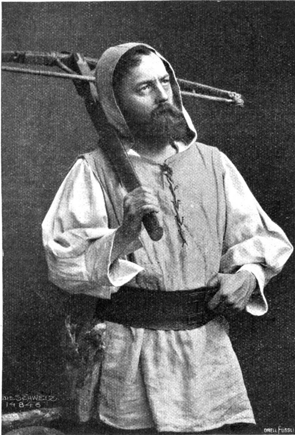
Der „Tell“ der Jubiläumsaufführungen des dramatischen Vereins der Stadt Bern.

hat den Versuch machen wollen, Tell beizuspringen, nämlich Michel; Werner hat ihn davon abgehalten, indem er ihm das Geheimnis des Bundes verrät (1930) und von dem Angriff Kenntnis gibt, der auf Geklers feste Burg unternommen werden soll. Er vergift Berners Vertrauen dadurch, daß er ihm seinerseits mitteilt, während der Nacht werde er von seiner Geliebten in eben diese Burg eingelassen werden: sobald er sie in Sicherheit gebracht habe, werde er ohne Schwierigkeit im Turm so viele seiner Freunde verstecken können, als er bei der Kürze der ihm zu Gebote stehenden Zeit zu sammeln vermöge.