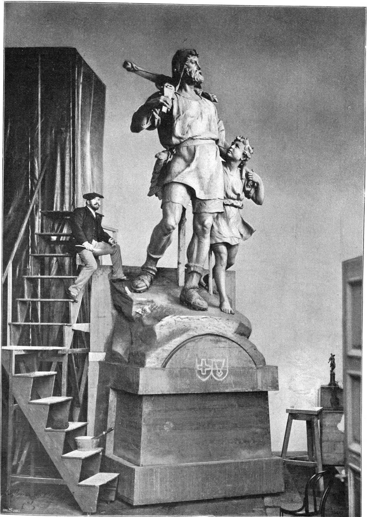
Richard Kisslings Tellstandbild im Atelier des Künstlers.