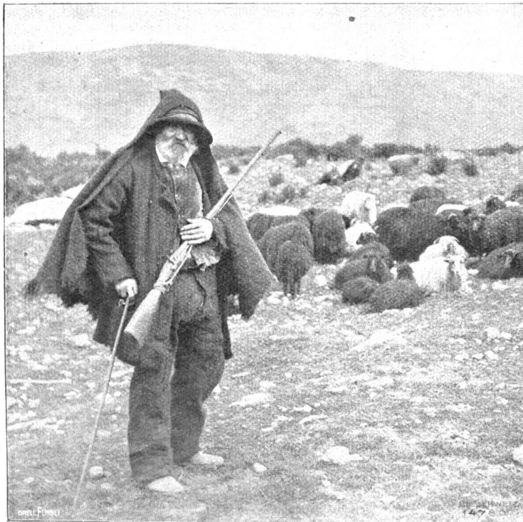
Korsischer Hirt mit Herde.

Ganz in der Nähe der Zitadelle steht ein Haus, die Casa Gaffori, das von oben bis unten von Flintenkugeln besprenkelt ist. Die Korsen zeigen den Fremden mit Stolz das alte Ge-