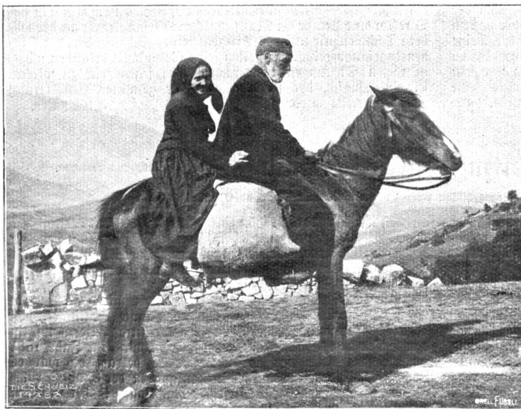
Korsika. Einritt zu zweien.

Die Sprache der Korsten gibt dem Fremden schon in Bastia die seltsamsten Rätsel auf. Es sind zwar fast alle Völkerstämme des Mittelmeeres, von den alten Griechen bis zu den modernen Franzosen, über die Insel weggegangen, und mancher fremde Stempel ließe sich aus diesem funterbunten Rassenmengsel ausfindig machen. Die nahe ligurische Küste und die jahrhundertlange genuesische Herrschaft haben aber doch dem korsischen Volkstum einen ausgesprochen italienisch-ligurischen Grundton gegeben, und ein italienisch-ligurischer Dialekt ist auch die Sprache der Korsten. Bis vor hundert Jahren ist auf der Insel die französische Sprache so fremd gewesen wie das Englische oder das Deutsche; heute aber — und das ist das Seltsame — spricht jedes Korstenkind, und wenn es auch noch so schwer geht, den Fremden in französischer Sprache an. Das Französische ist die offizielle Staats- und Gesellschaftssprache, und bis ins letzte Bergdorf hinauf gibt man sich alle erdenkliche Mühe, die italienische Abkunft zu verleugnen und vor dem Fremden demonstrativ den Franzosen herauszukehren. Die Korsten fassen es als eine Beleidigung auf, wenn ein Italiener sie als Landsleute in Anspruch nimmt, und die zahlreichen Italiener spielen auf der Insel ungefähr die gleiche Rolle wie bei uns in der Schweiz. Die Korsten nennen sie „Lucchesi“ im gleichen verächtlichen Sinn, wie man die Italiener in der deutschen Schweiz „Tschinggen“ zu titulieren pflegt. Die