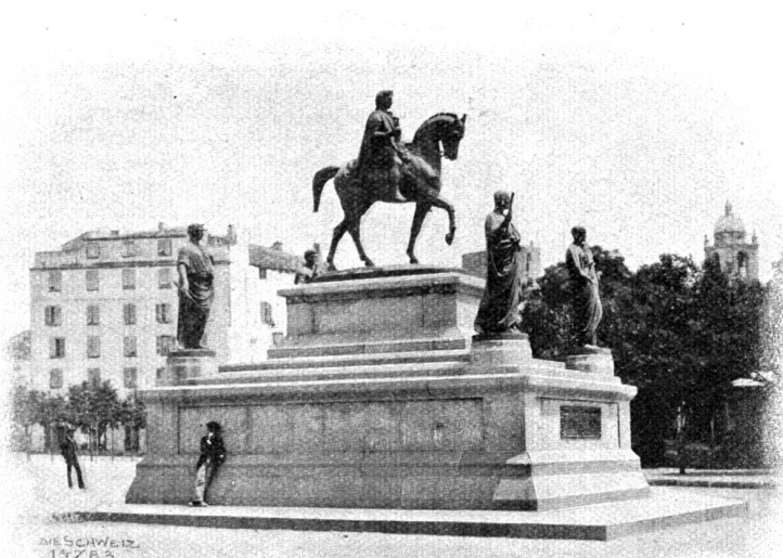
Korsika. Denkmal Napoleons in Ajaccio.

die sich stolz «Hôtel des voyageurs» nennt; drum herum liegen einige Villen im Chaletstil, Sommerwohnungen reicher Leute aus Ajaccio und dann ein großes Gasthaus, das „Grand Hôtel Bizzavona“, das einzige Touristenhotel Korsikas.