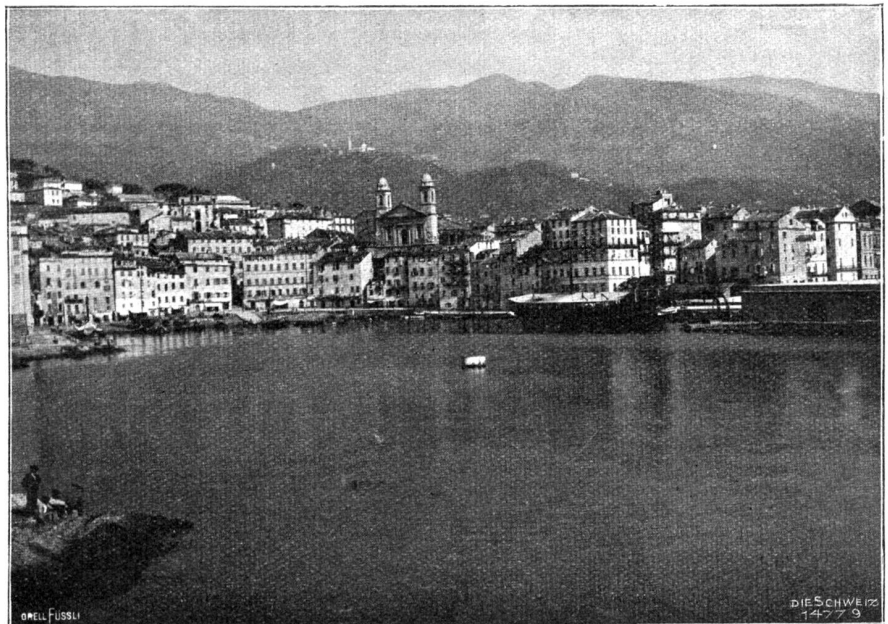
Bastia, Korsikas größte Stadt.

Man nehme Genua und Marseille zusammen, ein wenig Barcelona dazu und dividiere dann das Ganze durch dreißig, so wird man ungefähr ein Bild von Bastia bekommen. Die Stadt baut sich terrassenförmig am Berghang auf, malerisches Gewinkel drängt sich um die Zitadelle und den alten Hafen, und ein neuer Stadtteil zieht sich als Boulevard Paoli von der Altstadt zum neuen Hafen hinaus. Das Leben in der Stadt konzentriert sich tagsüber auf der Place St. Nicolas am Quai, einem Platz, um den manche Großstadt Bastia beneiden könnte. Von drei Seiten von schönen, fünfstöckigen Häusern umstellt, ist der Platz gegen das Meer hin offen, und in der Mitte steht der Herrgott Korsikas, Napoleon I., auf hohem Marmorpostament im römischen Imperatorenkostüm, Front gegen Elba hin. . . Der Blick ins Meer hinaus ist von zauberischer Schönheit; weit, weit in dem blauen Wasser, das sich in der Ferne messerscharf vom hellern Horizont abhebt, sieht man bei guter Abendbeleuchtung drei Inseln aus dem Meer emportauchen: links