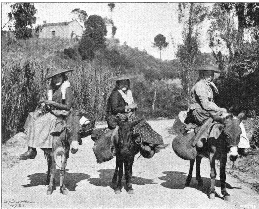
Korsika. Rückkehr zum Dorf.

des 3900 Meter langen Tunnels durch den korsischen Hauptgebirgszug; die Station liegt 906 Meter über Meer. Bizzavona selbst ist eine Neugründung, und es kam mir vor wie eine Ansiedlung im amerikanischen Westen. Ringsum, soweit der Blick reicht, in allen Flanken und alle Berghänge hinauf liegt stämmiger Hochwald, der stundenweite, in ganz Korsika berühmte Forst von Bizzavona, und mitten drin sonnt sich in einer herausgehauenen Waldoase ein Trüpplein von neuen Häusern. Neben der kleinen Station steht eine Bretterbaracke,