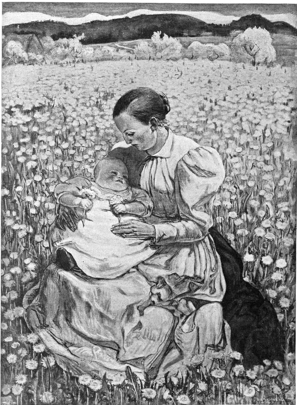
Mutter mit Kind. Nach dem Gemälde von Cuno Amiet, Solothurn, in Privatbesitz.