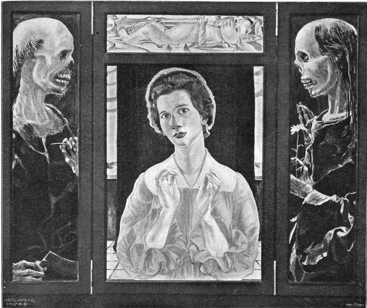
Die Hoffnung. Triptychon von Cuno Amiet, in Privatbesitz.

Jede andere Auffassung — ich denke hier an die unmalerischen Auslegungen der an und für sich durchaus gefundenen Freilichtmalerei, an die zitternde Luft, die malerisch niemals wiedergegeben werden kann, jede solche Auffassung würde den künstlerischen Charakter verlieren und leicht in Manieriertheit und Spielerei ausarten.