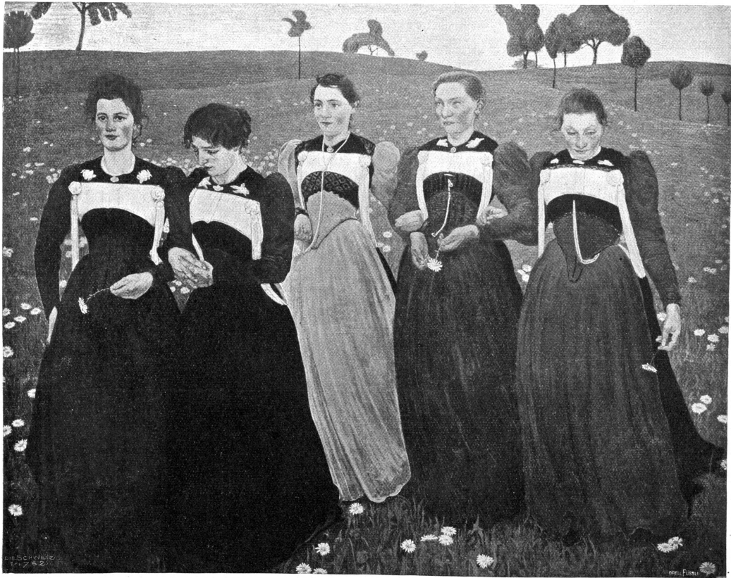
Richeesse du soir. Nach dem Gemälde von Guno Amiet im Museum der Stadt Solothurn.