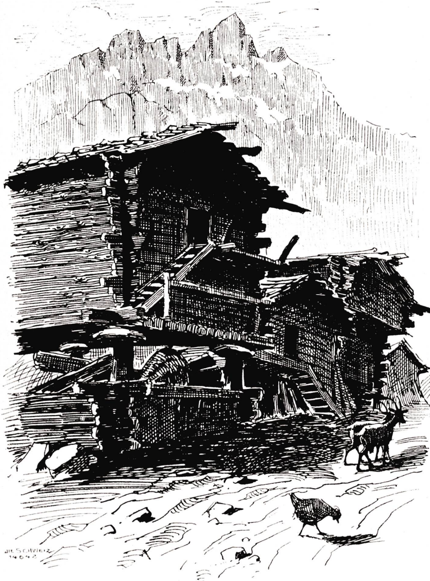
Caesch gegen die Mischabelgruppe. Nach Federzeichnung von Jakob Billéter, Basel.

gekrönten Säulen, zwischen denen der Wind durchspielen und das Wasser die Halde hinunterlaufen kann, wo auch das kleinste Vieh seinen Unterschlupf findet, ruht das einstöckige, aus braunem Lärchenholz gefügte Haus, zu dem man mittelst einer Leiter gelangen muß. Das Schindeldach ist abermals mit schweren Steinen belastet, die wieder mancherlei Gräslein und Kräutlein als Anhaltspunkt dienen, also daß das Ganze aus einiger Entfernung sich dem Auge kaum vom Boden abzuheben scheint. Die breiten Steinplatten über den Säulen sollen dazu dienen, die Mäuse vom Erstklettern der Häuser abzuhalten. Dem Gefüge des Hauses entspricht auch der Charakter des Volkes, das, in die einsame Stille des Hochgebirges gebannt, alltäglich sein Leben neu erkämpfen muß: wortlos trägt der Wildhauer die riesigsten Lasten auf der Schulter, um seinem Viehstand die Wintertrost zu sichern; wortlos besorgen die Frauen ihre Krautgärtchen und Wirtschaften in der verräucherten Steinhöhle, die als Küche dient; aber arbeitstüchtig ist das Volk und heimatsliebend und hat mit tapferer Hand gegenüber den begehrliehen Grafen und Herzogen von Savonen seine Selbständigkeit zu wahren gewußt, bis es sich zum ewigen Bund an die Eidgenossenschaft anschließen konnte.