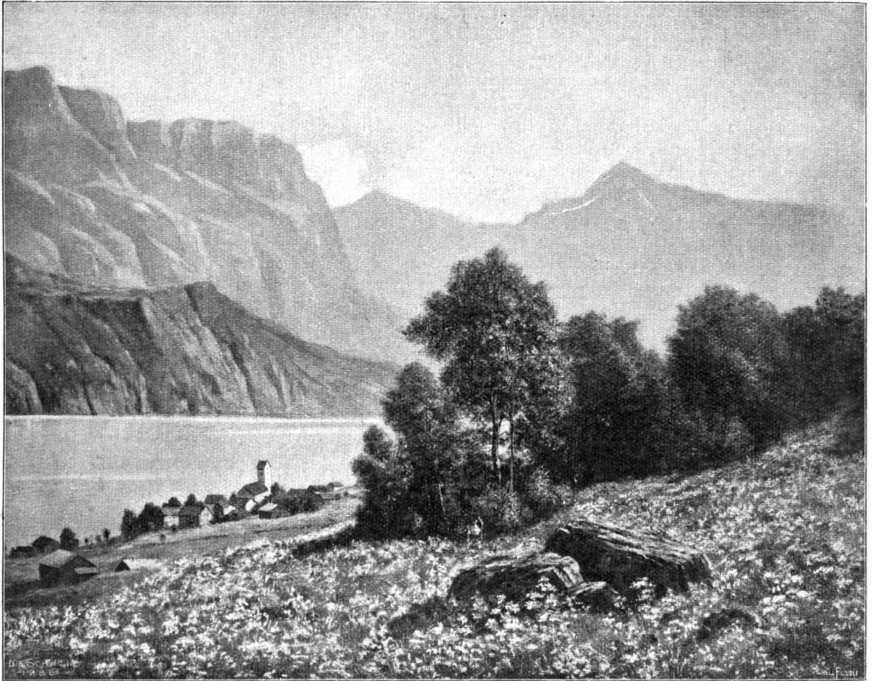
Frühling am Walensee (bei Obstalben). Nach dem Gemälde von Wafz Stäger, Zürich.

pen schlugen. Dicke Tropfen liefen die Fensterscheiben hinab.