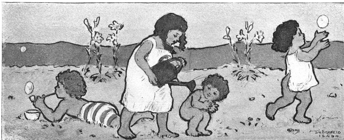
Luftbad. Nach Aquarell von Olga Burckhardt, Locarno.