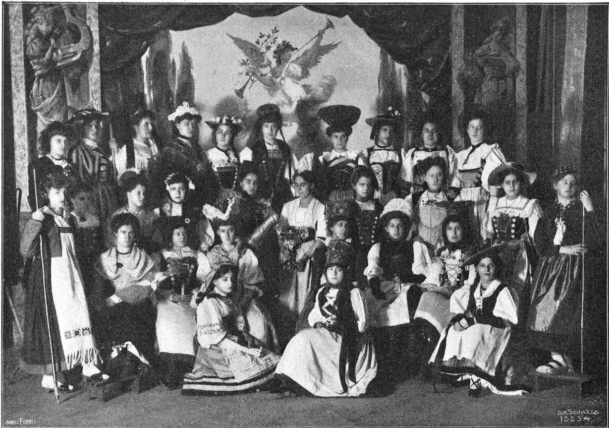
Von der Einweihung der neuen Rheinbrücke in Basel. Gruppe von Mädchen von Kleinbasel in den Landestrachten, mit Festpokal.

Ob Deinem letzten Brief habe ich stundenlang ganz wohniglich gelesen und das Abendbrot vergessen. Auf Deinen so rührenden und bedenklichen Zuspruch fange ich an, mich in allem Ernst einer besseren Ordnung zu befleißigen, und dazu habe ich meiner Bedienung besonders ernsthafte Aufträge gegeben! — Wegen meiner Gesundheit sei ohne Sorge, ich bin jetzt wieder recht tüchtig auf dem Zeug! — Anfangs Oktober hatte ich einen Anfall von kaltem Fieber, welches hier sehr grassiert, habe mich aber deswegen nicht geniert, die Kollegien zu besuchen, gab mir bis zum Hinfallen Bewegung, und so ging es wieder, wie es kam. Man muß nur nicht gleich Furcht haben, sondern ringen und wagen, solange noch Kräfte sich regen; auf sich vertrauen und Gott allein und nicht jeder Krankheit glauben, das sind die ersten Heilmittel, welche den Tod bezwingen. Wie oft macht der Glaube den Kranken gesund oder den Gesunden krank! Wie oft schon hat dieser Glaube, verbunden mit einer empfindlichen Einbildung, daß dies oder jenes Jahr eines Menschen letztes sei, die blühendste Lebenskraft gelähmt und ins Grab getragen! — Solange der Mensch glaubt, so ist er so stark wie er glaubt und stärker als er meinte — — —