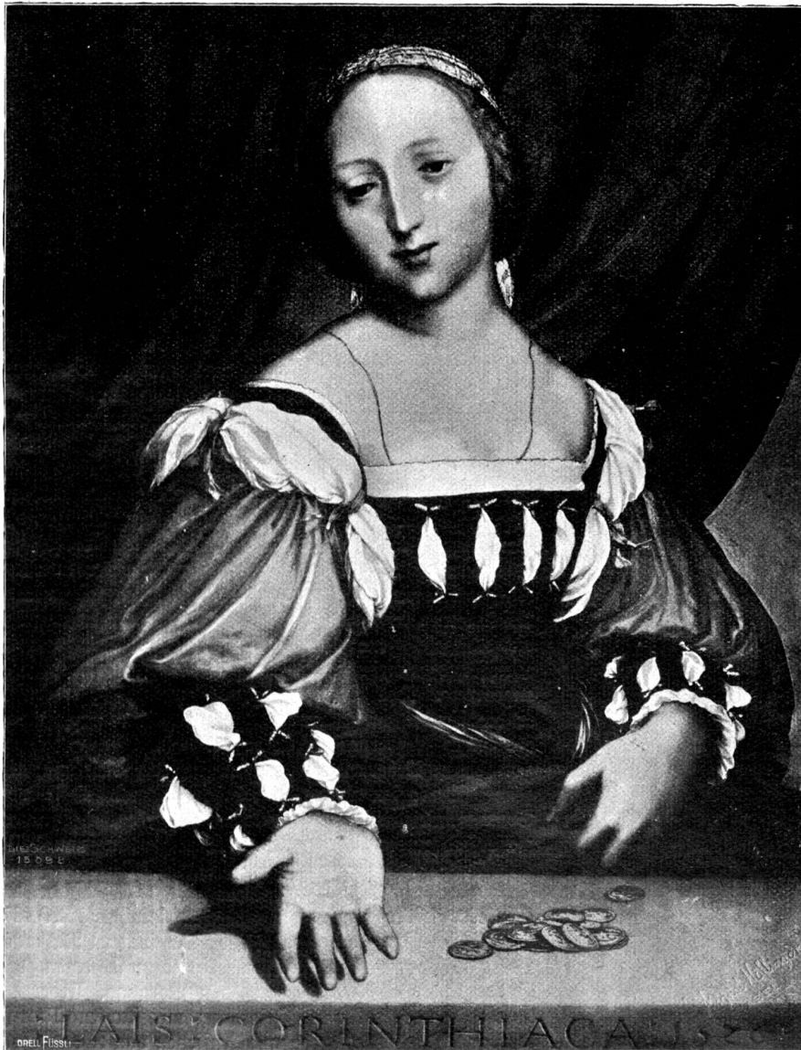
Hans Holbein d. J. Bildnis der Dorothea von Offenburg als Lais von Korinth (1526) in der öffentlichen Kunstsammlung zu Basel.