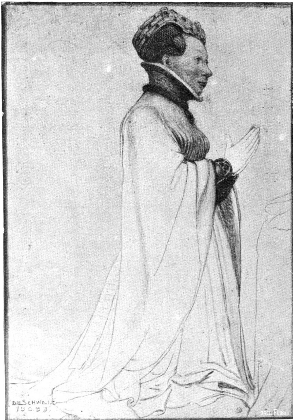
Hans Holbein d. J. Statue der Herzogin von Berry vom Grabmal in der Kathedrale von Bourges. Nach der Zeichnung in der Oeffentlichen Kunstsammlung zu Basel.

Im Jahre 1521 erhielt Holbein den Auftrag, den Ratssaal auf dem Rathhaus mit Gemälden auszumücken. Die Darstellungen waren von Beatus Rhenanus aus antiken Historikern zusammengestellt worden und sollten den Ratsherren das Beispiel der Gerechtigkeit vorführen. Den dunkeln Raum verwandelte der Künstler in einen reichgegliederten Renaissancesaal mit statuengeschmückten Nischen und setzte die figürlichen Kompositionen zwischen die selbstgeschaffenen Gliederungen hinein. Die Kompositionen selbst sind stark architektonisch gedacht und symmetrisch angeordnet. Nach Vollendung von zwei Wänden erhielt er die für die ganze Arbeit ausgesetzte Summe; es bleibt aber noch die Frage offen, ob die beim Rathhausumbau gefundenen Ueberreste der alten Fassadenbemalung, liegende Allegorien über den Torbögen und Teile von Statuen, nicht auf Holbein selbst zurückgehen. Möglicherweise sind uns in der Bock'schen Neubemalung von 1608 noch Teile des alten Schmuckes erhalten. Die Verwandtschaft der ersten Rathhausbilder mit der Fassade des Hauses „zum Tanz“ und dem Glasgemälde von 1520 läßt sich bis ins Einzelne nachweisen. Die spätern Rathhausbilder lassen die Architektur beiseite und legen das Hauptgewicht auf den dargestellten Vorgang. Ueber die Malweise der Arbeiten, Zeichnung mit starkem Umriß, leichter Anlage der Farbe und Aufsetzen von echtem Gold