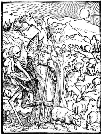
Holzschnitt aus Holbeins Totentanz „Der Bischof als Hirte“.

Lage der einzelnen Muskeln fühlbar sind. Ein Meisterwerk seelischer Vertiefung ist das trübe Auge mit geschwellenen Lidern. Die Modellierung im vollen Lichte mit grauen Halbtönen entspricht der absolut modernen Auffassung, und die feste Geschlossenheit der Gruppe im Dreieck verstärkt die gewaltige, aber in den Mitteln schlichte Wirkung.