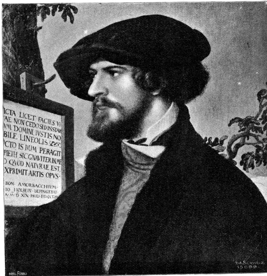
Hans Holbein d. J. Bildnis des Rechtsgelehrten Bonifazius Amerbach (1519) in der öffentlichen Kunstsammlung zu Basel.