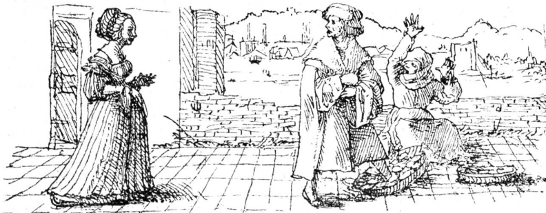
Hans Holbein d. J. Federzeichnung aus dem „Lob der Nartheit“ (Dissimulata stultitia).

Im Jahr 1532 verließ Holbein Basel, um sich bleibend in England niederzulassen, trotz eines Anerbietens des Rates, ihm eine Pension auszusetzen und ihn mit seinen Kunstwerken reifen zu lassen. Anlässlich eines Besuches im Jahr 1538, bei dem des Künstlers Ankunft durch ein Festessen in der „Mädg“ gefeiert wurde, erneuerte der Rat von Basel sein Angebot. Aber Holbeins Ruhm stand in England so hoch, seine Stellung war so angesehen und von den Höchsten im Lande anerkannt, daß er den ehrenvollen Angeboten der Heimat kein Gehör schenken konnte. Er war der bevorzugte Porträtmaler des königlichen Hofes und der hohen englischen Aristokratie; er gelangte, wie hundert Jahre später Van Dyck, durch die Ähnlichkeit der ihm gewordenen Aufträge zu einer an Manierismus grenzenden, aber stets bestechenden Ausdrucksweise. Mit Verzichtleistung auf den momentanen Ausdruck hält er die Züge des Gesichtes ruhend fest und erreicht dabei trotz starker Beto-