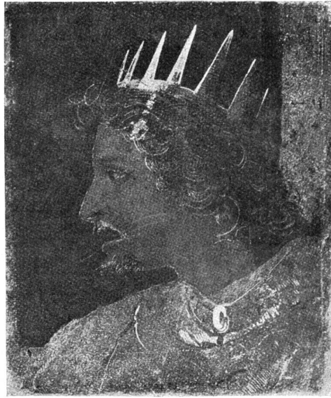
Hans Holbein d. J. Kopf des Königs Nebuchadnezzar (Bruchstück aus einem Wandgemälde des Rathauses zu Basel).