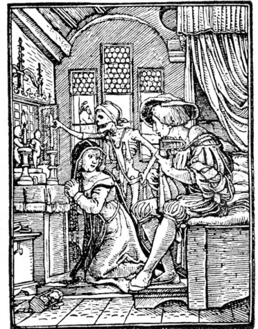
Holzschnitt aus Holbeins Totentanz „Die Nonne“.