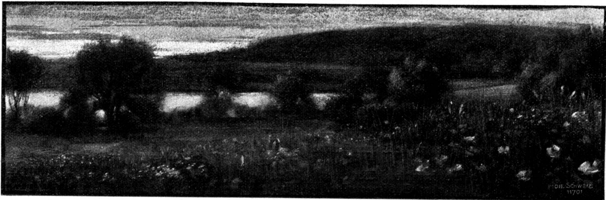
Am Ammersee (Bayern). Nach Kohlenzeichnung von Hans Meyer-Cassel.