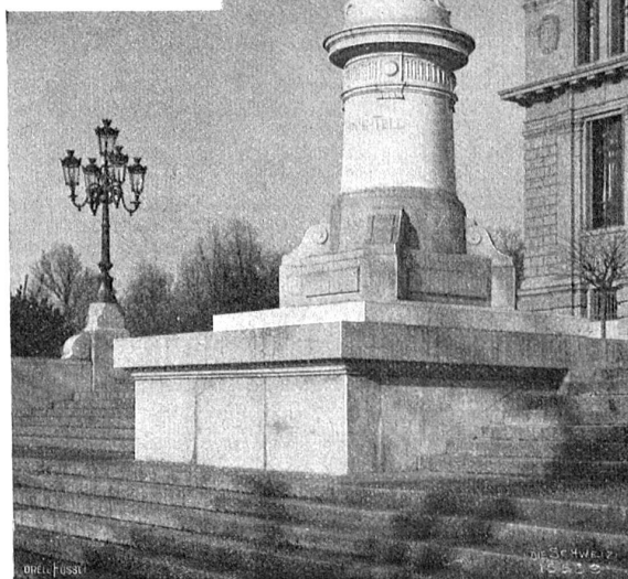
Cellstatue von Antonin Mercié, Paris, von dem Pariser Bankier D'Arès der Stadt Lausanne gestiftet zum Danke für die gute Aufnahme der 1871 Interentien.

Das Bundesgericht kann demnach Bundesgesetze, allgemein verbindliche Beschlüsse und von der Bundesversammlung genehmigte Staatsverträge nicht nach ihrer Vereinbarkeit mit der Bundesverfassung überprüfen, während es nicht allgemein verbindliche Bundesbeschlüsse und Verordnungen des Bundesrates auf ihre Übereinstimmung mit der Bundesverfassung überprüfen und eventuell außer Anwendung lassen kann. Dingengegen können kantonale Gesetze vom Bundesgericht auf ihre Ver-