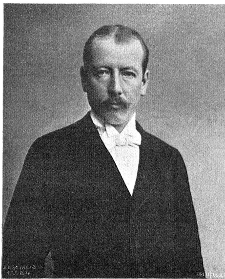
Meinrad Lienert.

Doch Meinrad Lienert ist nicht nur ein origineller Erzähler, er ist auch ein Humorist. Der wildblodernden Leidenschaft, deren Feuer das Gute im Menschenherzen versengt, stellt er den Humor zur Seite, damit er ihren schwerlastenden Bann löse. Diese Paarung des Tragischen mit dem Komischen ist es, die allen Werken Lienerts einen eigenen Stempel aufbrückt. Wie lebensfreudig tönt sein fröhlicher Sang in Versen „Der letzte Schwanaritter“ 4) , wie herzerquickend sein Liebesidyll in Schwyzermundart „s Mirli“ 5) ! Auch seine „Lieder des Waldsinken“ 6) , denen es neben aller Fröhlichkeit nicht an ernsten, tiefen Tönen fehlt, sind ein Beweis der Ursprünglichkeit dieser Dichternatur. Denn Meinrad Lienert ist ein Sonntagskind, das nicht nur die Herzenssprache seines Bergvölkchens wie kein zweiter versteht, er weiß auch die Sprache der trutzigen Berge, das Raunen der Wälder und Quellen, den munteren Schlag der