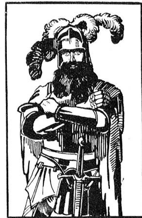
DIE SCHWEIZ 1527B.

Da traf den Großen ein Blick voll Schmerz und Betrübniß aus des Freundes Auge, daß er den eigenen niederschlug. Er hatte in den Wochen vaterländischer Gefahr, die nun hinter ihm lagen, seinen Geist ganz auf Kampf und Sieg gerichtet und alles vergessen, was sein Mannesherz so leicht in Flammen der Leidenschaft auflodern ließ. Nun ward er plötzlich seines Vergehens inne und hatte ein um so stärkeres Gefühl seiner Schuld gegenüber dem Freunde, als dieser mit den Ratsherren und den Besten und Wägsten seiner Vaterstadt hinausgeißelt war, um seine Größe mitzufeiern, ja ihn eigentlich durch einen prunkhaften Triumphzug vor aller Welt zum Gegenstand der Verehrung zu machen. Denn es gibt für den Mann kein erhebenderes, aber auch kein vernichtenderes Urteil als das des Freundes, mit dem man die Unschuld der Jugend verlegt hat. Sie ist der Spiegel, in dem sich Freunde immer wieder erkennen; Waldmann aber hatte ihn befleckt. Das abgewandte, nach innen gekehrte Auge Zur Silgens war wie gebrochen, und Waldmann wußte, daß ein Unheil geschehen war, das nicht mehr gut gemacht werden konnte. Dennoch wagte er den Versuch, legte den Arm um des Freundes Schulter, zog ihn auf die Seite und flüsterte ihm voll Bewegung zu: „Diethelm,