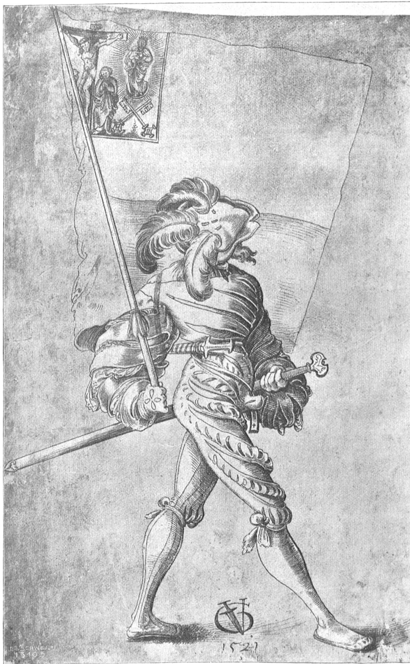
Landsknecht mit Fahne. Nach der Federzeichnung (1527) von Urs Graf (1480 geb. zu Solothurn), im Besitz der Gottfried Keller-Stiftung, deponiert in der Kupferstichsammlung des Eidg. Polytechnikums.

Aber ich hatte kaum die Moskitovorhänge meines Bettes sorgfältig ringsum unter die Matratze geschoben, um mir eine ungestörte Ruhe zu sichern, als ein entferntes Geschrei, aus dem ich deutlich das aufregende Wort „Amok!“ zu unterscheiden glaubte, mich mit einem Sage wieder aus dem Bette springen, den Revolver ergreifen und hinauszufliehen ließ.