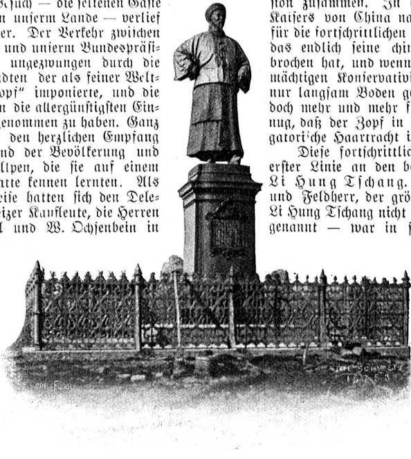
Li Hung Tschang-Denkmal in Shanghai.

Diese fortschrittlichen Tendenzen erinnern uns in erster Linie an den bedeutendsten Namen Chinas, an Li Hung Tschang. Er, der gewaltige Staatsmann und Feldherr, der größte Kanzler Chinas — man hat Li Hung Tschang nicht umsonst den chinesischen Bismarck genannt — war in so hervorragender Weise für den Fortschritt seines Landes tätig, daß man mit Recht das moderne China als sein Werk bezeichnen kann. An der Eröffnung Koreas, dessen Verkehr mit China unter seiner Aufsicht stand, war Li Hung Tschang in erster Linie beteiligt. In den zahllosen Verwicklungen mit den Westmächten hat sein außerordentliches diplomatisches Geschick sich bewährt, und Li Hung Tschang war es, der fort und fort für die