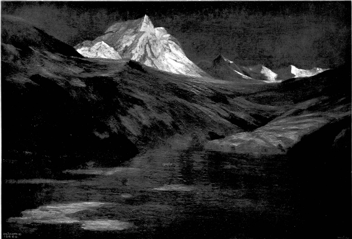
Mondnacht auf dem Berninapass. Nach dem Gemälde von Wilhelm I. Lehmann, Zürich-München.