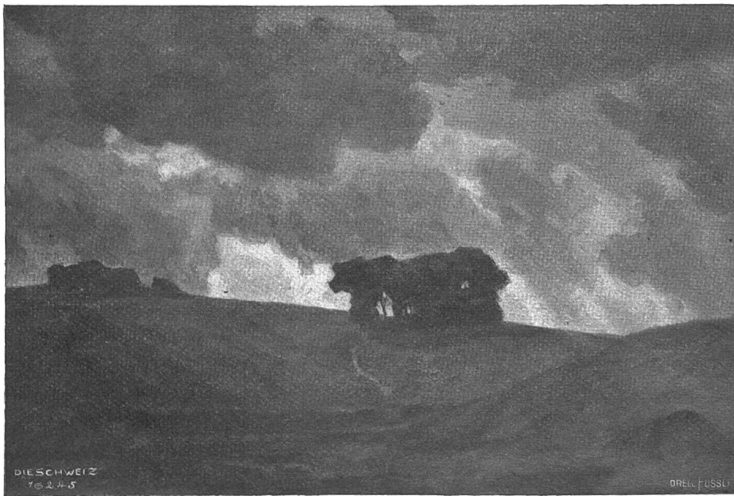
Herbsttag. Nach dem Gemälde von Wilh. Ludwig Lehmann, Zürich-München.

Nachdruck verboten. Alle Rechte vorbehalten.