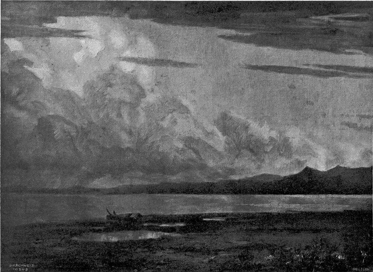
Chiemsee-Stimmung. Nach dem Gemälde von Wilh. Ludwig Lehmann, Zürich-München.

Cosimo war aufs tiefste ergriffen von der Aufmerksamkeit, die er augenblicklich durchschaute. Er stürzte sich nicht hin, der göttlichen Gestalt zu Füßen, er verharrte unter dem Vorhang, als wollte er die Weihe der Offenbarung nicht stören. Nicht die Anwesenheit Sylvias war es, sondern der freudige Schreck, der ihn gebannt hielt, der ihn selbst verhinderte, laute Worte der Begeisterung auszurufen.