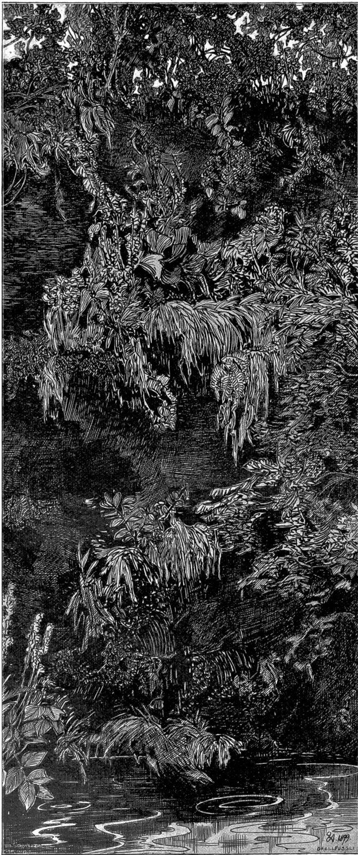
Waldquelle. Nach Federzeichnung von Emil Anner, Brugg.

Was er hier sah, das erfüllte ihn mit Bewunderung: es war eine Trilogie der höchsten Vollkommenheit, die in seiner eigenen Künstlerseele den Wunsch aufkeimen ließ, sein Leben auch unter diesen in Kunst und Wissenschaft ernst beflissenen Männern zubringen zu dürfen. Kunst, Wissenschaft und Mönchsleben waren hier in so herrliche Harmonie zu einander gesetzt, durch-