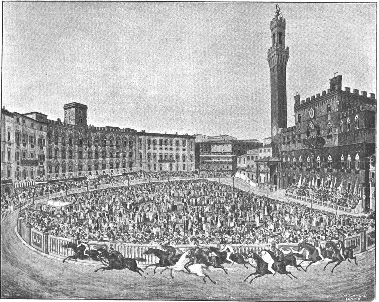
Der „Dallo“ (Mittelnächtliches Volksfest mit Pferderennen) auf dem Marktplatz zu Siena. Wgl. S. 448 ff.

starrer Jammer vor der Mutter, wo das Verhängnis sich Falte um Falte enthüllt, das traf nun eben die Grenze des menschlich Tiefstergreifenden und des Besinnungsräubenden, Herzbetäubenden. Und Don Cesar, dem soviel unverhaltbare Tränen mitleidenden Jammers geflossen sind, wo er, vorher so warmblütig freundlich, jetzt in der düstern Würde des erd- und menschenhobenen Verfallenen dasteht! Ueber sein Verbrechen wächst sein Schmerz empor und reißt ein Mitleid mit, in dem die Tragik dieser Dichtung ihre tiefste Wirkung erreicht.