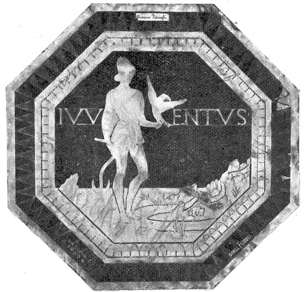
Juventus (Jünglingsalter). Nach dem Mosaik des Antonio Federighi († 1490) im Dommuseum zu Siena. Vgl. S. 444 f.