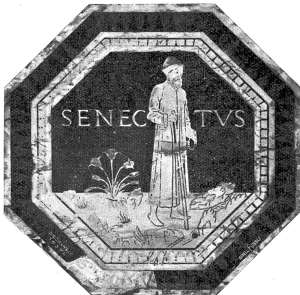
Senectus (Greisenalter). Nach dem Mosaik des Antonio Federighi († 1490) im Dommuseum zu Siena. Vgl. S. 444 f.

Zu schildern, wie der Gang der gewaltigen Tragödie gewachsen, wie Schauer und tiefes, weiches Mitleid über diese Menschenmasse kamen, wer wollte das versuchen? Nur ein Wort noch von den Schauspielern. Des Publikums erklärte Anmut waren Beatrice und Don Cesar. Von ergreifender Anmut waren dies Spiel und die Gestalt, alles schuldblos, rein und weiß an diesem ins furchtbar rauhe Getriebe der Menschenburg verflatterten Schmetterling des Klostersgartens. Diese scheue Liebe und Wehrlosigkeit, dies Zagen und Bangen und dann die dem leichten Körper sich entringenden Laute des überwältigenden Entsetzens, wie an einem Tag alle Hoffnung dieses hauchzarten Lebens unter dem Eisendruck der Lebensmächte verzittert und verglimmt, wie diese Beatrice vor uns lebt, hofft, bangt und unerhörtes Leid erfährt, ihr erster scheuer Eintritt und ihr er-