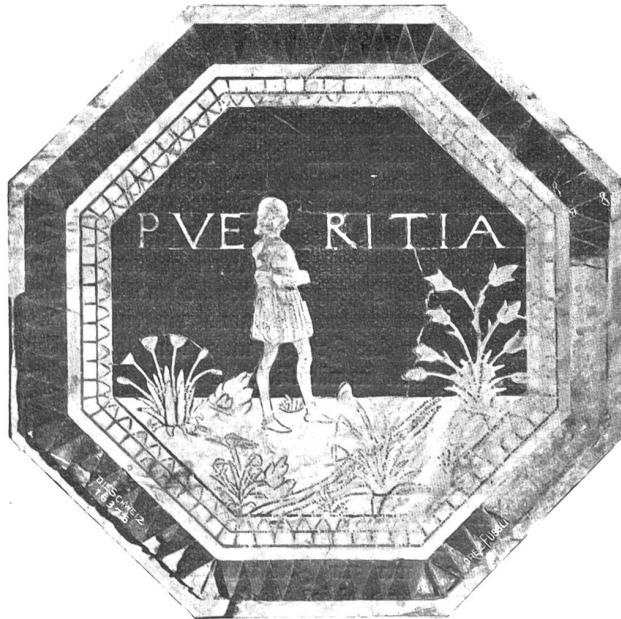
Pueritia (Knabenalter). Nach dem Mosaik des Antonio Federighi († 1490) im Dommuseum zu Siena. Vgl. S. 444 f.