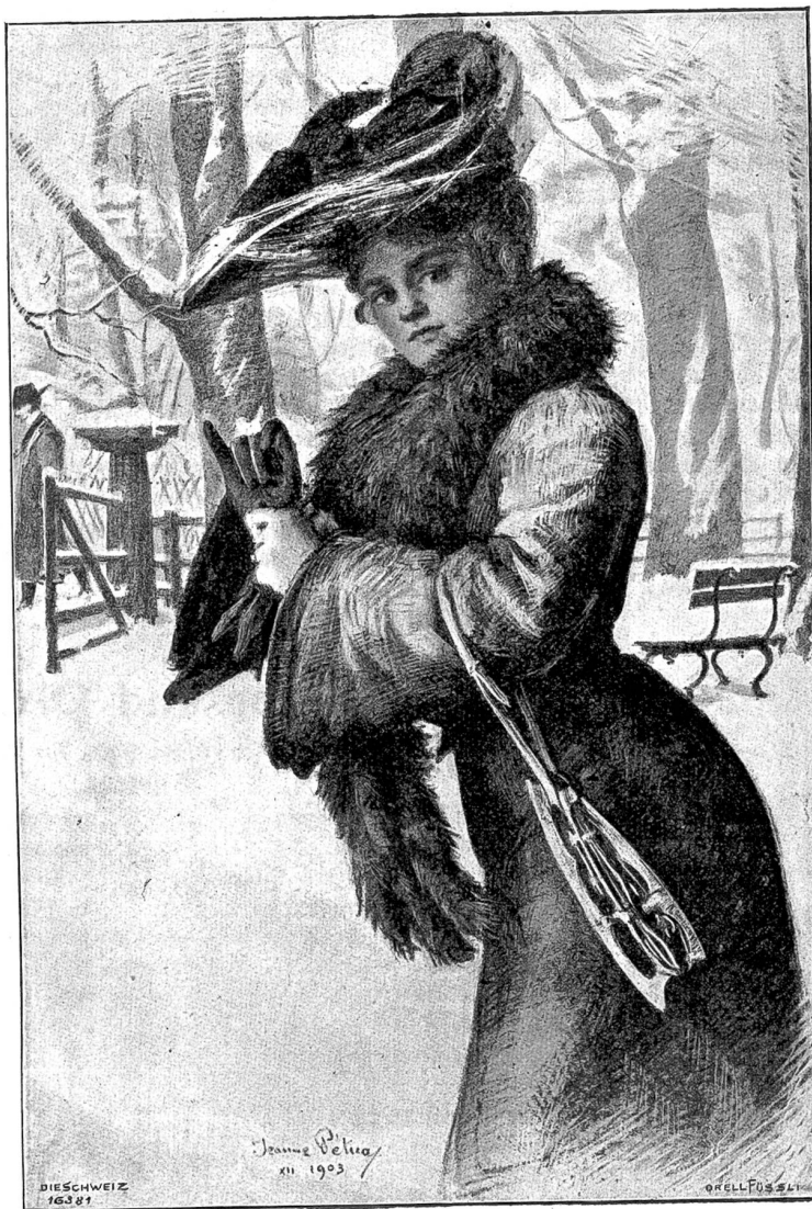
Schlittschuhläuferin. Nach Original lithographie von Jeanne Pétiou, Winterthur.

Ein ohrenbetäubendes Gepolter rasselte jetzt in seine Träume. August zuckte zusammen. Aufschauend sah er, wie alle seine Mitschüler emporgefahren waren, gleich Rekruten in Achtungstellung dastanden und nach der plötzlich auffliegenden Tür starrten. Dort stand der rotbärtige „Ton“ schon auf der Schwelle und spähte mit