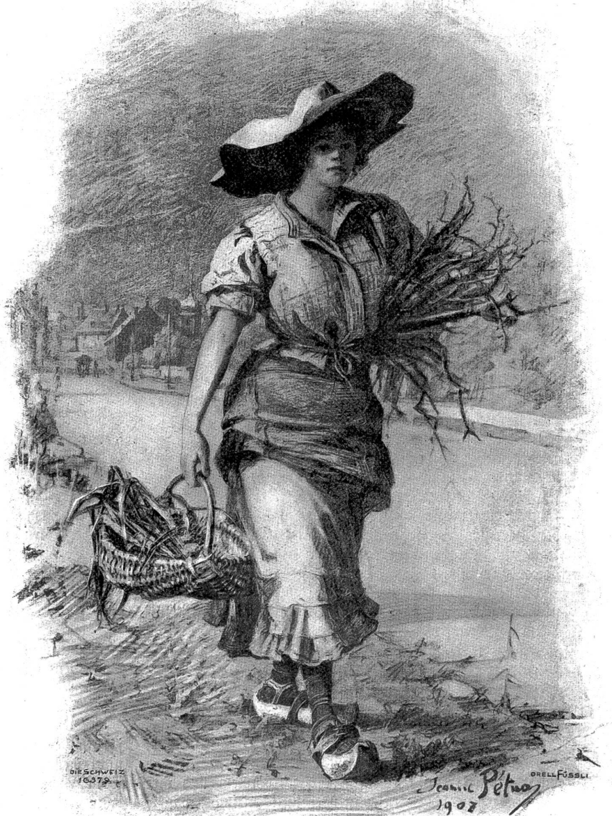
Bauernmädchen aus dem Jura. Nach Original lithographie von Jeanne Pétua, Winterthur.

„Jetzt zeige, was du kannst!“ Es war ihm, als hätte die kraftvolle Stimme des Vaters diese Worte ausgerufen. Von jungem Heldenmut erfüllt, tauchte er unter. Der Körper des Lebensmüden wurde jetzt von den Wo-