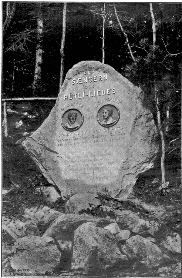
Denkstein für die Sänger des Rütlliedes J. G. Krauer und Jos. Grelth.

Das Vorspiel führt uns in die Passahnacht vor dem Aufstand gegen die Römer. Der Tod steht mitten auf dem Markt und betrachtet sich Jerusalem. „Die heilige Stadt mit ihrem Tempelhaus, noch ragt sie in gespenstisch weißem Glanze. Der Herr des Lebens ging hier ein und aus; die Städte wählt' ich mir zum Totentanz.“ Er ruft sein Gefinde auf: den Krieg, die Not, die gelbe Pest. Sie sollen sich bereit halten. Wenn der Mann in diesem Hause da sein Werk besorgt, dann sollen