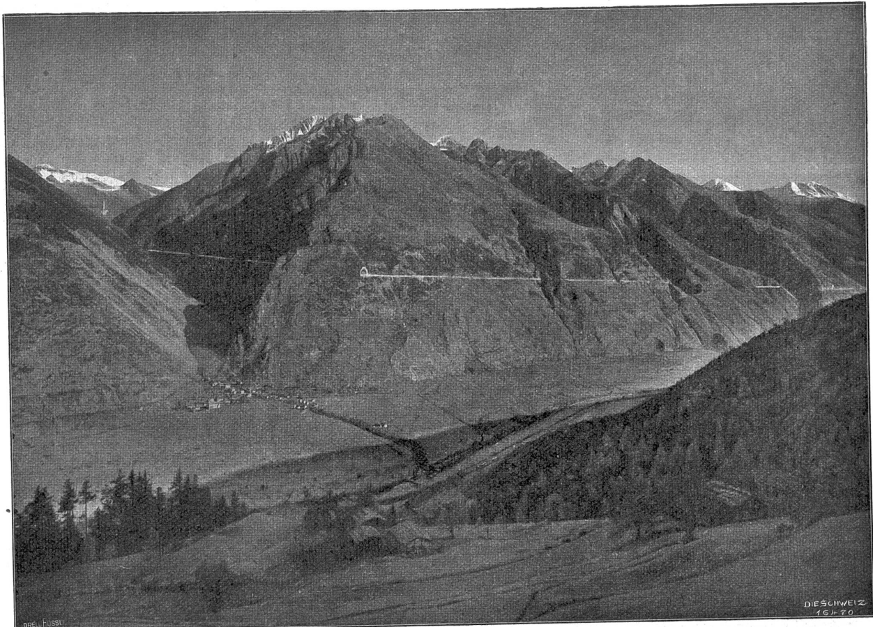
Von der Lötschbergbahn. Uebersicht über das Bahntracé auf der Südselte, Ausmündung des großen Lötschbergtunnels bei Goppenstein (Y), Anlage durchs Lötschentäl, Austritt ins Rhonetal (460 m über Gampel), Weiterführung über den Berggrücken und die tiefengehauenen Schluchten bis in das Gebiet ob Arzon.

fester um die Wintererde sich zogen, da flossen sie zusammen zu geheimnisvollen Gestalten. Wie es dann unruhig wurde über dem kalten Gewässer, wie es wallte und wogte zwischen dem fahlen Gestrüpp und den knorrigen blätterlosen Weidenbäumen am Ufer! Bis die Nebelgebilde höher empor sich schlangen, hinzogen nach den kleinen Bauernhütten, die sich aneinander schmiegten auf dem einen steilen Rande des Flusses. Ging nicht ein wundersamer Klang und sonderbares Rauschen durch die Abendluft, jenes Abends, da die „Swjatk“ anbrachen im alten Lande von Mütterchen „Rußj“ 1) ? Umhüllten die Nebelstreifen und Schneebüfte nicht Agafias schöne „Siba“ mit ihren weiten, großen Schleiern, bis von ihr nichts zu sehen war?