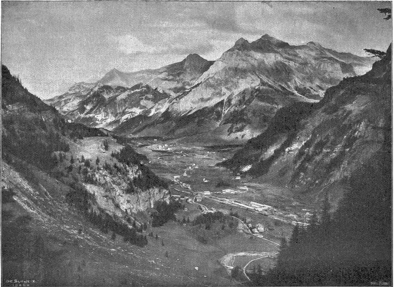
Von der Löttschbergbahn. Blick vom Gemmiweg auf Kandersteg und über das Kanderthal; rechts der Eingang zum großen Löttschbergtunnel, im Vordergrund Installationsbauten für den Tunnel.

und die Gesamtlänge des Stollens hat auf Ende Oktober bereits 2179 Meter erreicht. Bekanntlich ist noch in erster Stunde durch Bewilligung der Bundessubvention der doppelspurige Ausbau des Tunnels ermöglicht worden, sodaß nun bald mit der Ausmauerung begonnen werden kann. Ein großes Hemmnis für das rasche Fortschreiten der Arbeiten bildet die Schwierigkeit der Zufuhren, besonders auf der Südseite, sodaß in Eile ein vollständiges schmalspuriges Dienstgeleise erstellt werden mußte. Auf der Nordseite ist dieses, da man auf das definitive Trace nicht Bedacht nehmen mußte, bereits dem Betriebe übergeben, während auf der Südseite, wo man wegen der vielen Tunnels sich genauer an die definitiven Verhältnisse der Bahn anlehnen mußte, die Inbetriebsetzung erst nächsten Sommer erfolgen kann. Auf der ganzen Linie von Brieg bis ins Löttschental herrscht eine emsige Tätigkeit, und wenn mittags und abends die gewaltigen Sprengminen entladen werden, könnte man sich