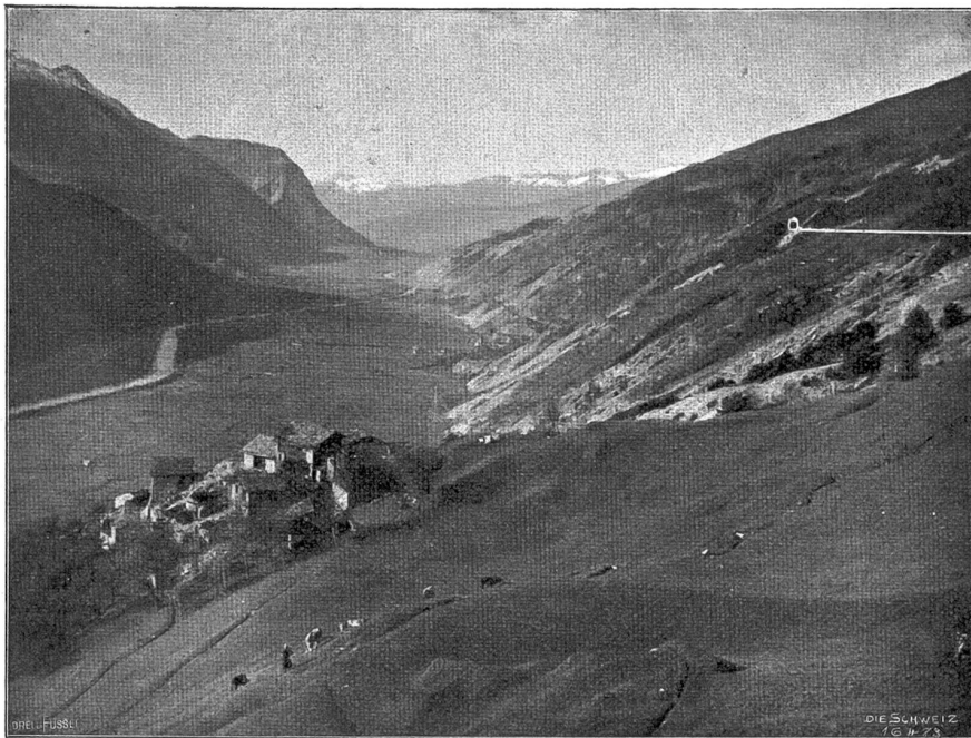
Von der Lötschbergbahn. Blick von der im Bau befindlichen Strecke ob Maron gegen das Unterwallis bis Sitten.

Sie weiß nichts zu sagen, schlägt verwirrt die Augen zu Boden. Wie sie diese wieder aufschlägt, da steht er dicht bei ihr, prächtig anzublicken in seiner hohen Fellmütze, und schaut ihr tief, unwiderstehlich in die Seele hinein, wie damals in der Mitternachtsstunde. Und dann faßt er sie an beiden Händen. Seine Stimme klang anders wie zuvor, als er endlich sagte: „Agafia Semenowna, was geht mit uns vor? Was meint Ihr dazu?“