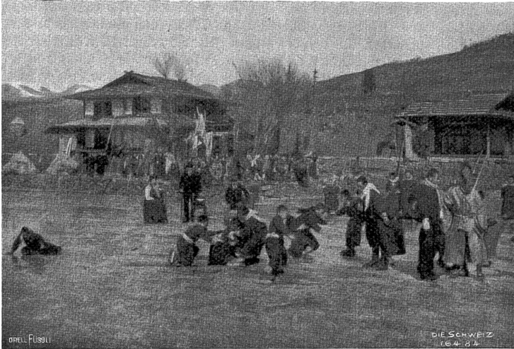
Auf dem Suwako. Wettrennen.

die Zeit zur Abfahrt; doch hatte sich der Himmel, der uns vier Tage so gnädig gewesen, bewölkt, und wie wir die Schlitt-