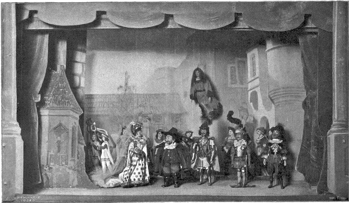
Marionettentheater in St. Gallen. Szene aus Puccis „Stolzer Hildegard“.

kindlein vom Jahre 1901 schenkte mir die ersehnten Puppen, wie sie mir achtundvierzig Jahre früher die liebe Mutter in einfacherer Form unterm Glanze des Weihnachtsbaumes entgegengehalten hatte. Dazu Miniaturmöbel, Geschirren und Dekorationen in reichster Fülle und die nötige Umrahmung. Das Spielzimmer im Souterrain meines Heims am Rosen-berg bildete das Versuchslaboratorium für Bühnenkonstruktion, Inszenierung und Vortragskunst. Am 22. Februar 1902 erste Galavorstellung im Beisein meiner eigenen und der Nachbars-