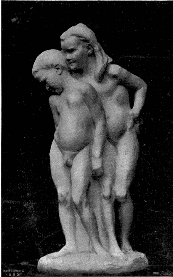
Kindergruppe (1905) von Hugo Siegwart, Luzern-München.

Es war für Peter eine Wollust dies zu schauen. Wenns einen Gott gab, er hatte ihn nun gestraft, daß er ihm ein so einsam trauriges Leben beschieden, keine Freude und kein Glück. Mit dem Stolze des Rheinbaders, der in seinem Gefühl Großes vollbracht, zog er heimwärts.