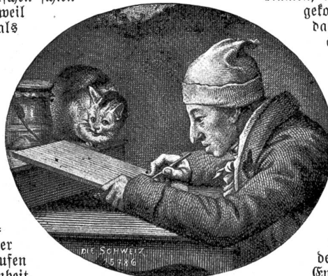
Gottfried Mind (1768—1814).

In der Tat ein dürftiges Erdenwallen! Und doch vermochte die Geschichte dieses armen Lebens, die sich seinerzeit irgendwie zwischen unsere Kinderbücher verirrt hatte, einst unsere kindliche Phantasie aufs reichste anzuregen. Das arme verkrüppelte Kind, zu schwächlich zum Spielen und Arbeiten, zum Lernen zu unbegabt, in dem sich eines Tages ein großes Talent offenbart, das aus dem verachteten Knaben einen Künstler macht, das war so recht ein Liebling der kindlichen Seele, die gern von Erhebung der Kleinen und Schwachen träumt und für die der Künstler noch der Auserlesene unter den Menschen ist. Und dann lernten wir den armen Worblauserbuben unter jenem Namen, der wohl erst nach dem Tode Minds angekommen ist, als Katzenraffael kennen, und das machte ihn uns doppelt lieb. Die Käzchen mit ihrem lieben Schnurren, dem lustigen Spielen und dem weichen Fellschen waren ja auch unsere Lieblinge; denn Kinder, die weiche Zierlichkeit lieben und sich vor zerkrachten Händchen nicht fürchten, glauben nicht an die berüchtigte Falschheit der Kage. So dachten wir uns denn den Katzenraffael vom Blicke seines wunderbaren Könnens verflärt mitten unter seinen Lieblingen, die er so naturgetreu zu malen wußte,