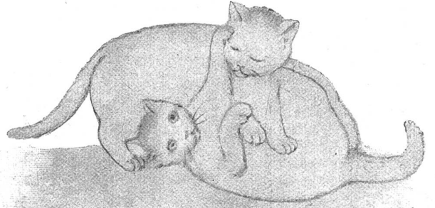
DIE SCHWEIZ 1906 38