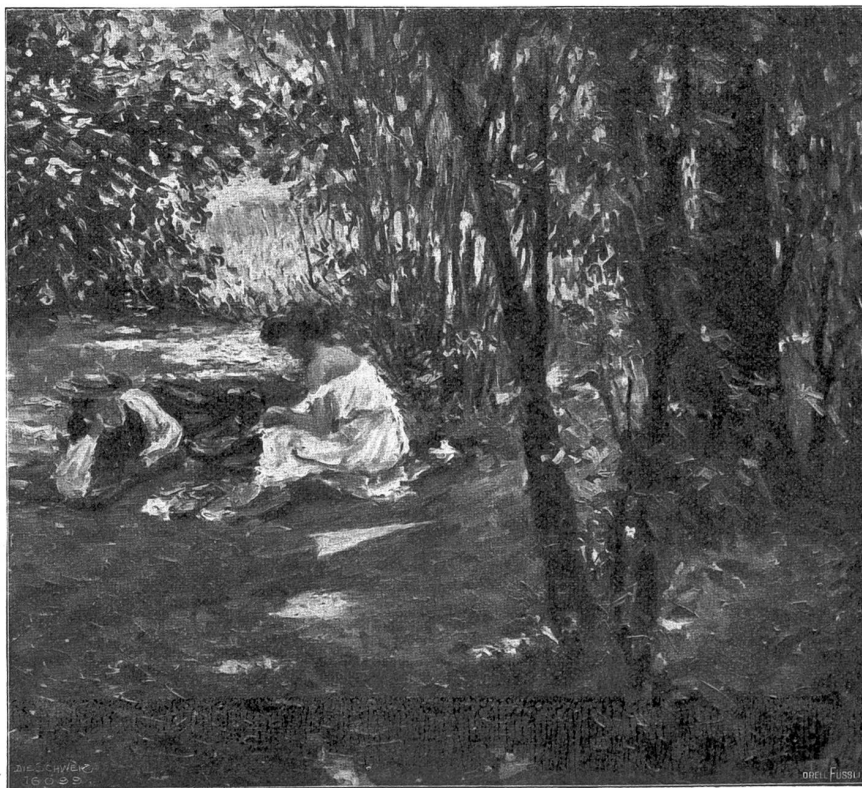
Sommertag. Nach dem Gemälde von Fritz Oswald, Zürich-München.

Die Mütter sind bereits aufgestanden, da es schon elf Uhr