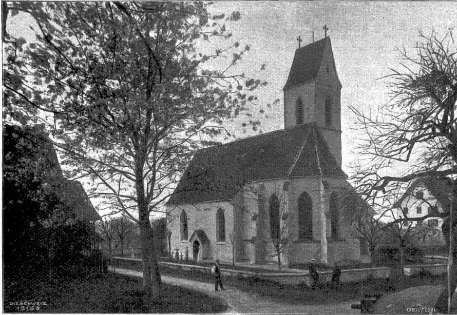
Kirche St. Wolfgang bei Hünenberg, Rt. Zug, von der Chorseite gesehen (Phot. Eduard Weis, Zug).

Die Vorliebe der alten Zuger für ihre St. Oswaldskirche zeitigte reiche Schenkungen, die namentlich in der Stiftung kostbarer Kultusgegenstände zum Ausdruck gekommen sind. Das Schicksalsjahr 1798 hat zwar den Kirchenschatz erheblich erleichtert, da man sich seiner zur Bestreitung der Kriegskontribution bedienen und zu diesem Zwecke mehrere Stücke einschmelzen mußte. Das Vorhandene verdient aber immer noch, gesehen und bewundert zu werden. Beim Öffnen des großen Sakristeischrankes mutet es den überraschten Beschauer an, als wäre der sagenhafte Nibelungenhort vor ihm aufgestiegen. Da glänzen und gleichen die Erzeugnisse der Goldschmiedekunst, silberne Vortragskreuze, Leuchter und Weihrauchgefäße in getriebener und ziselierter Arbeit, goldene und silberne Kelche und Monstranzen und endlich die großen, besonders durch ihr Gewicht an Edelmetall imponierenden Prozessionsbilder. Eines dieser letztern, den Erzengel Michael im Kampfe mit dem Teufel darstellend, hält an die vierzig Pfund reinen Silbers. Von den